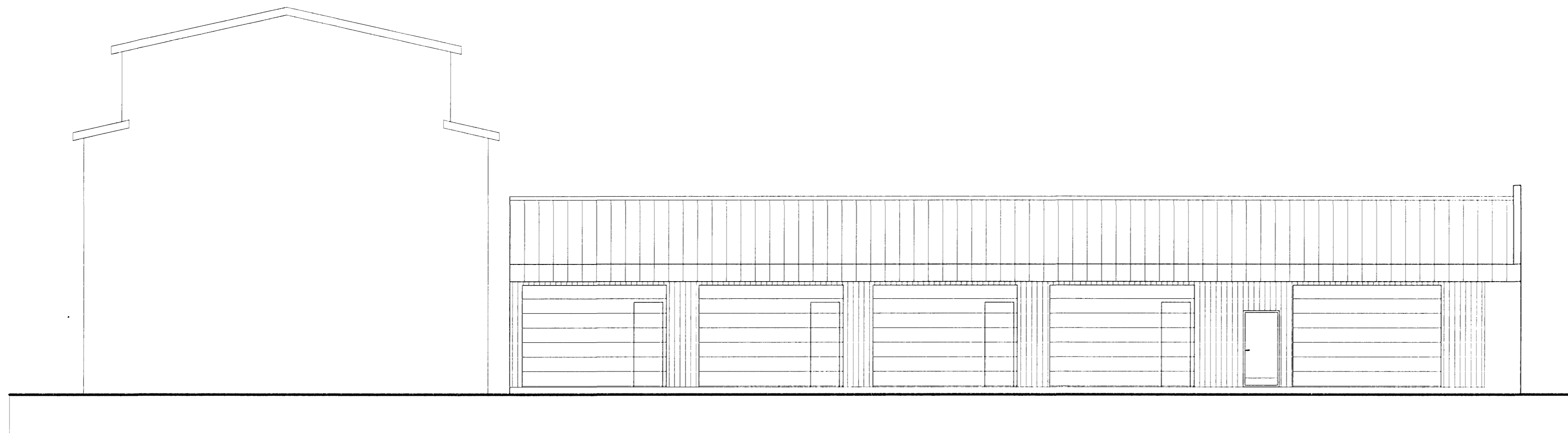
ÚTLIT AUSTUR 1:100