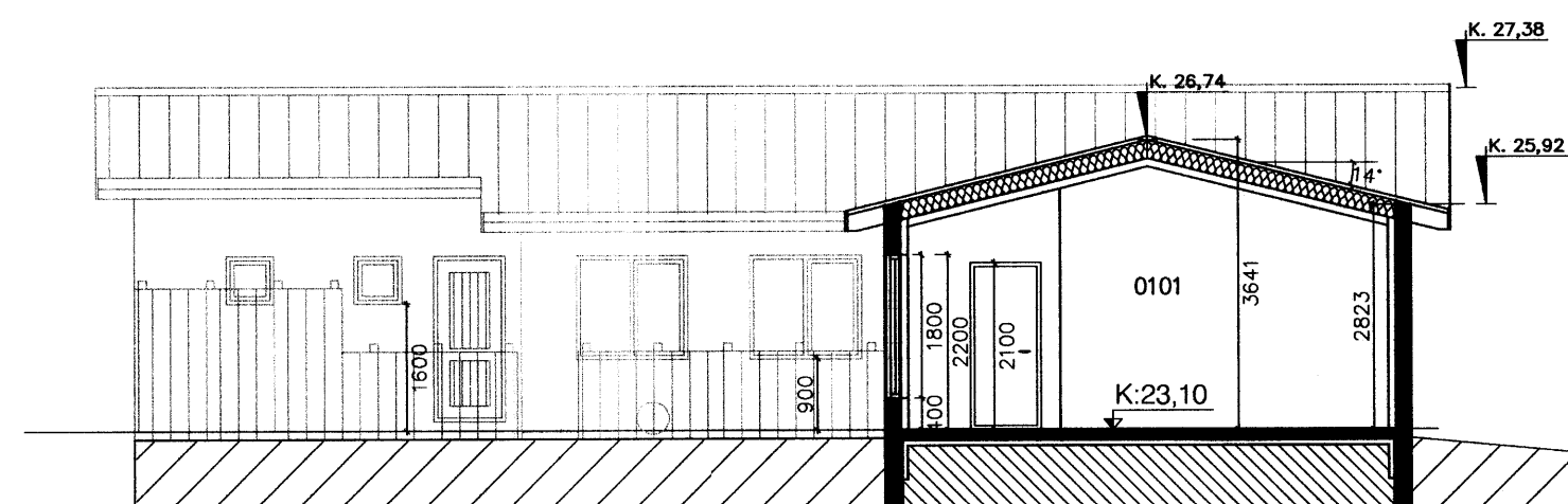
SNID B-B Borðstofa og stofa. 1:100