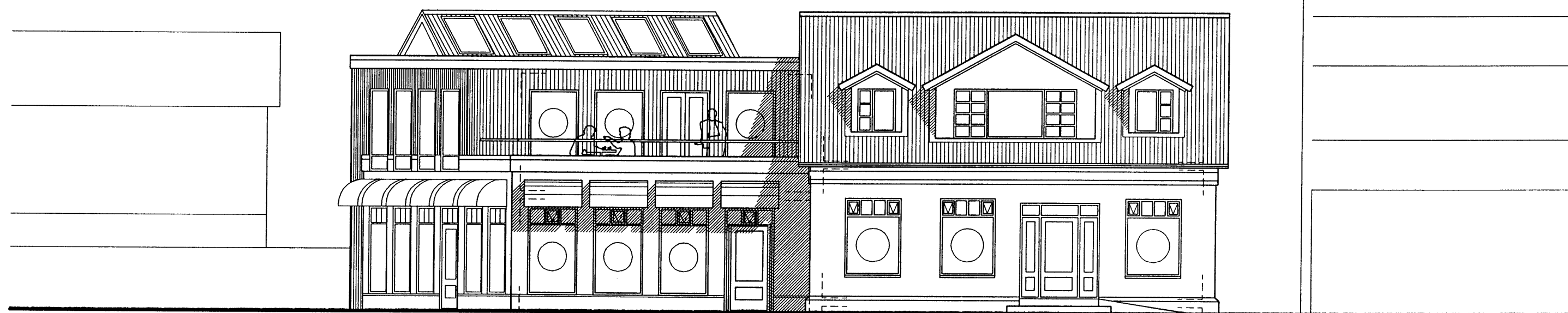
▲ Ásýnd suð-vestur m.kv. 1:100