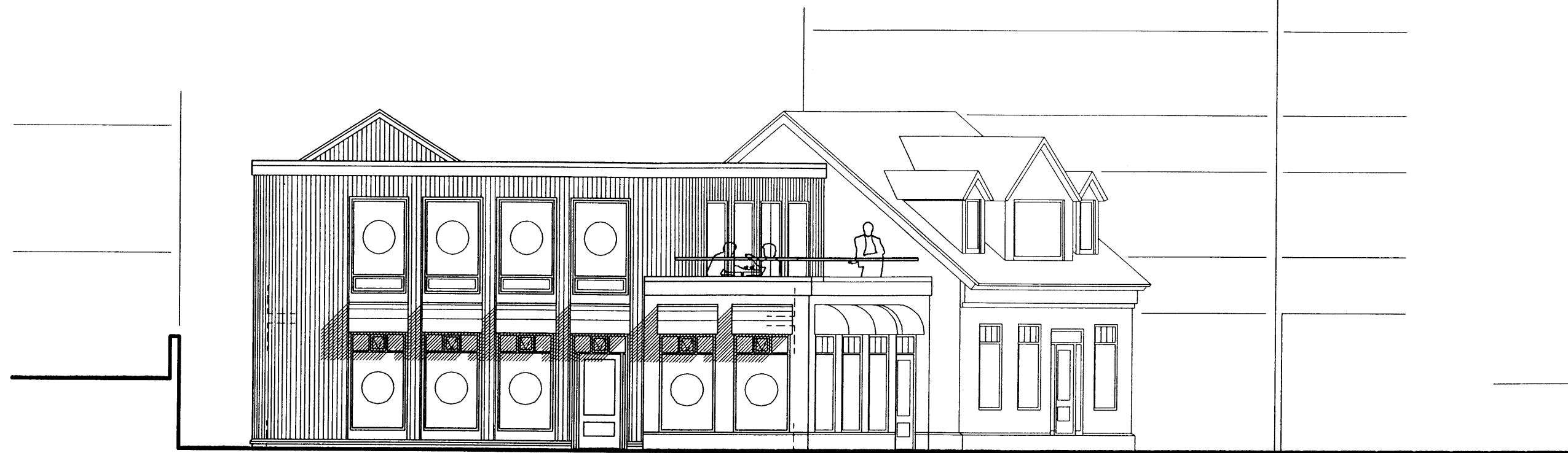
Ásýnd norð-vestur m.kv. 1:100