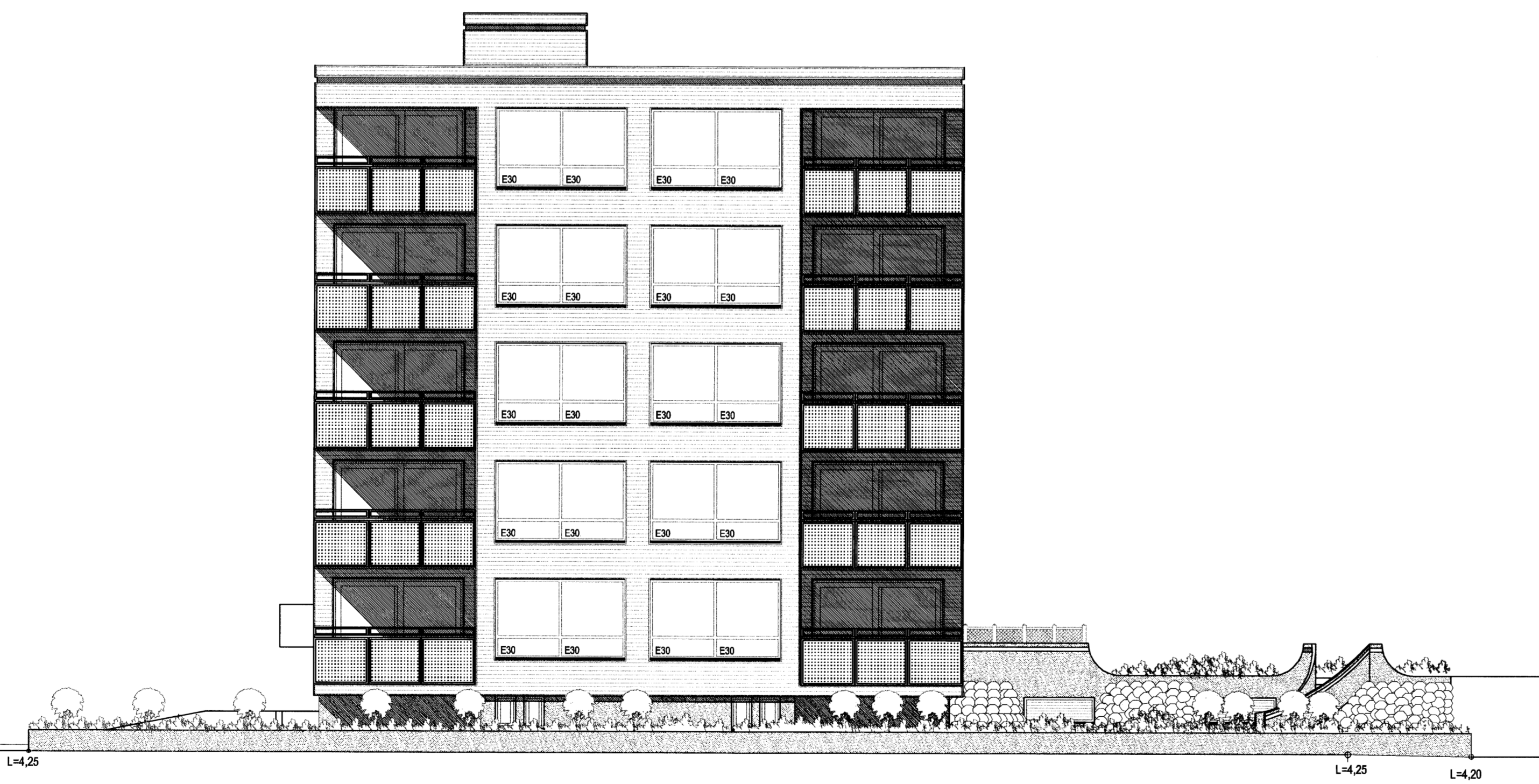
SUÐUR. MKV. 1:100.