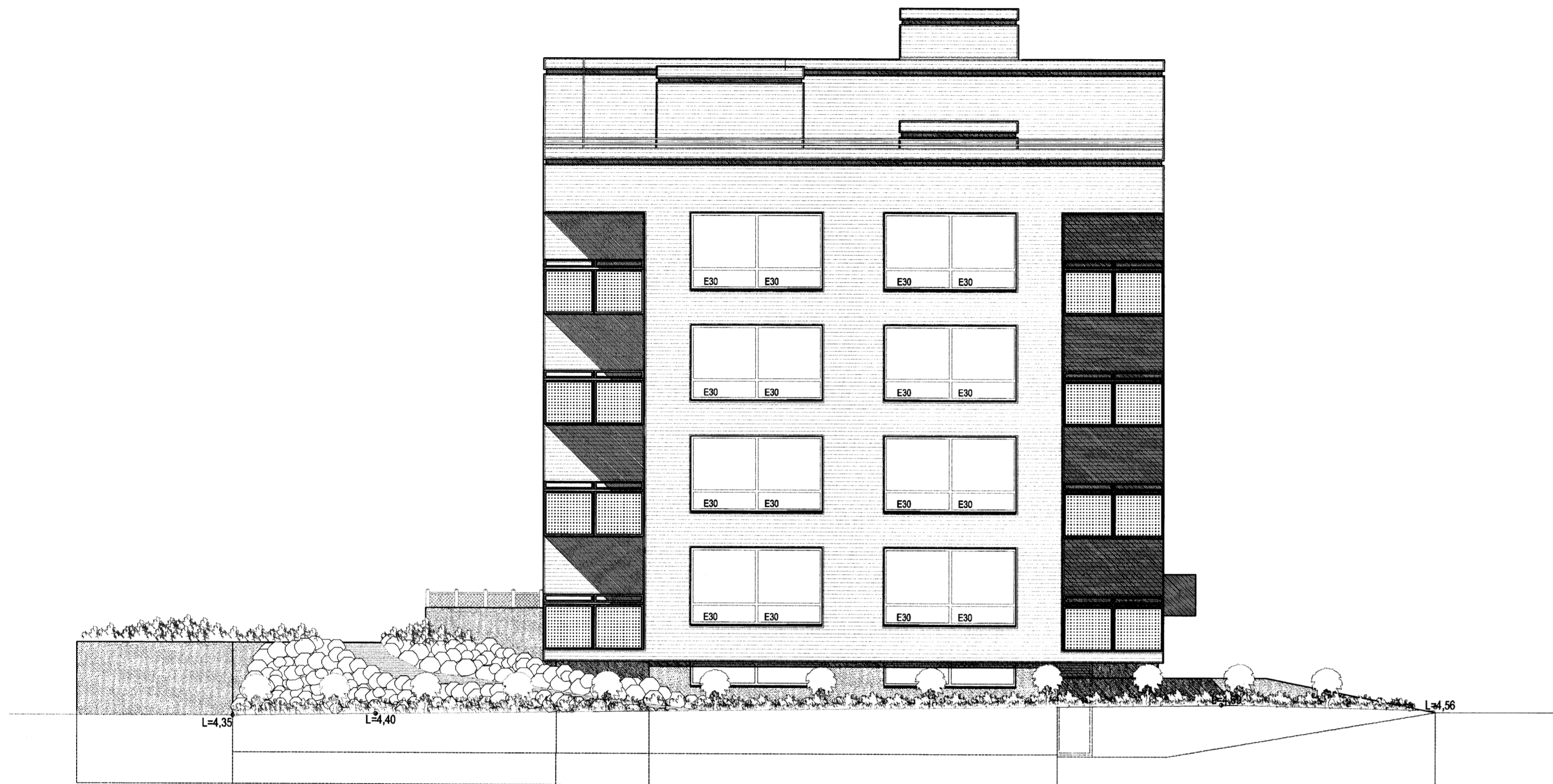
NORÐUR. MKV. 1:100.