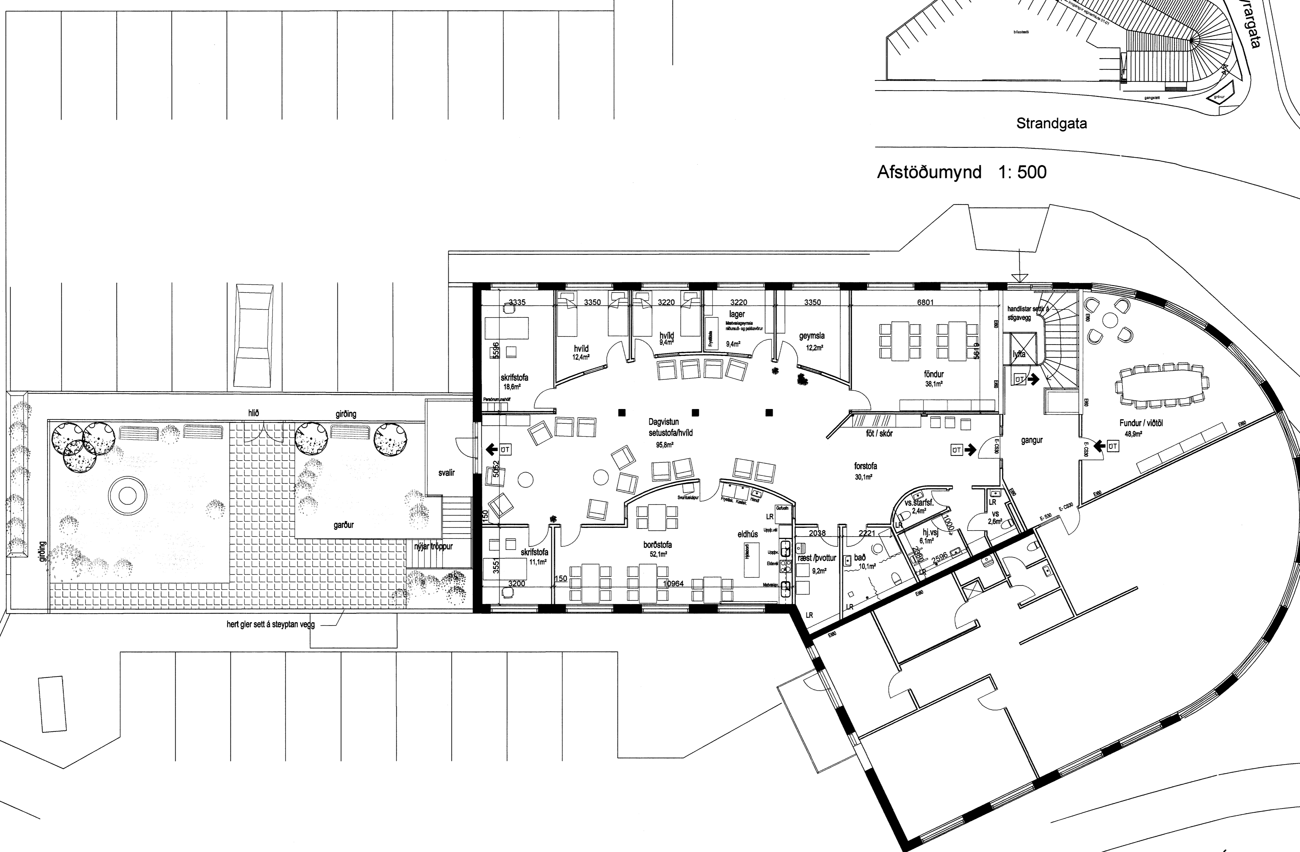
Grunnmynd 3. hæðar 1:100