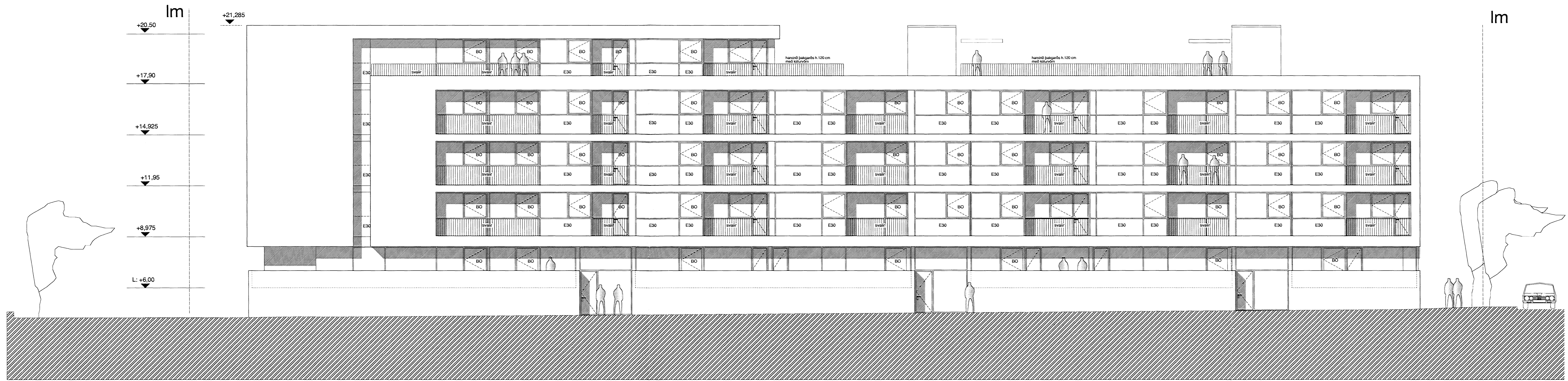
útlit Norðurbakki 7 - Austur