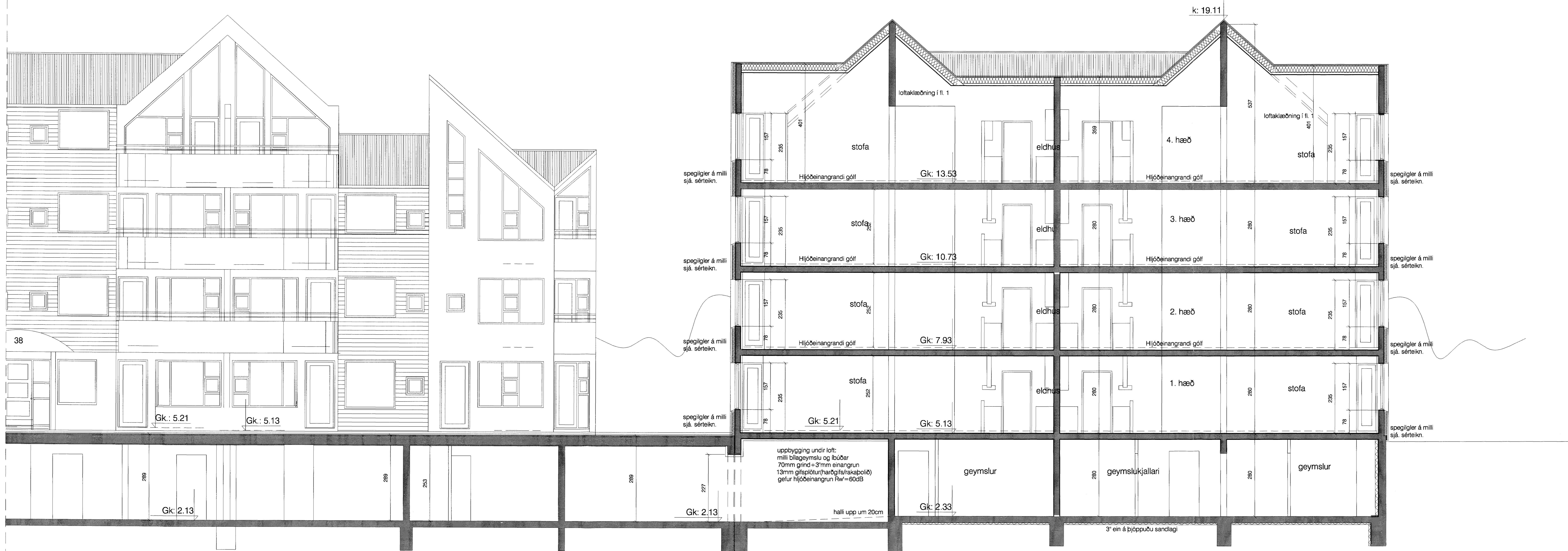
sneiðing A-A frh.