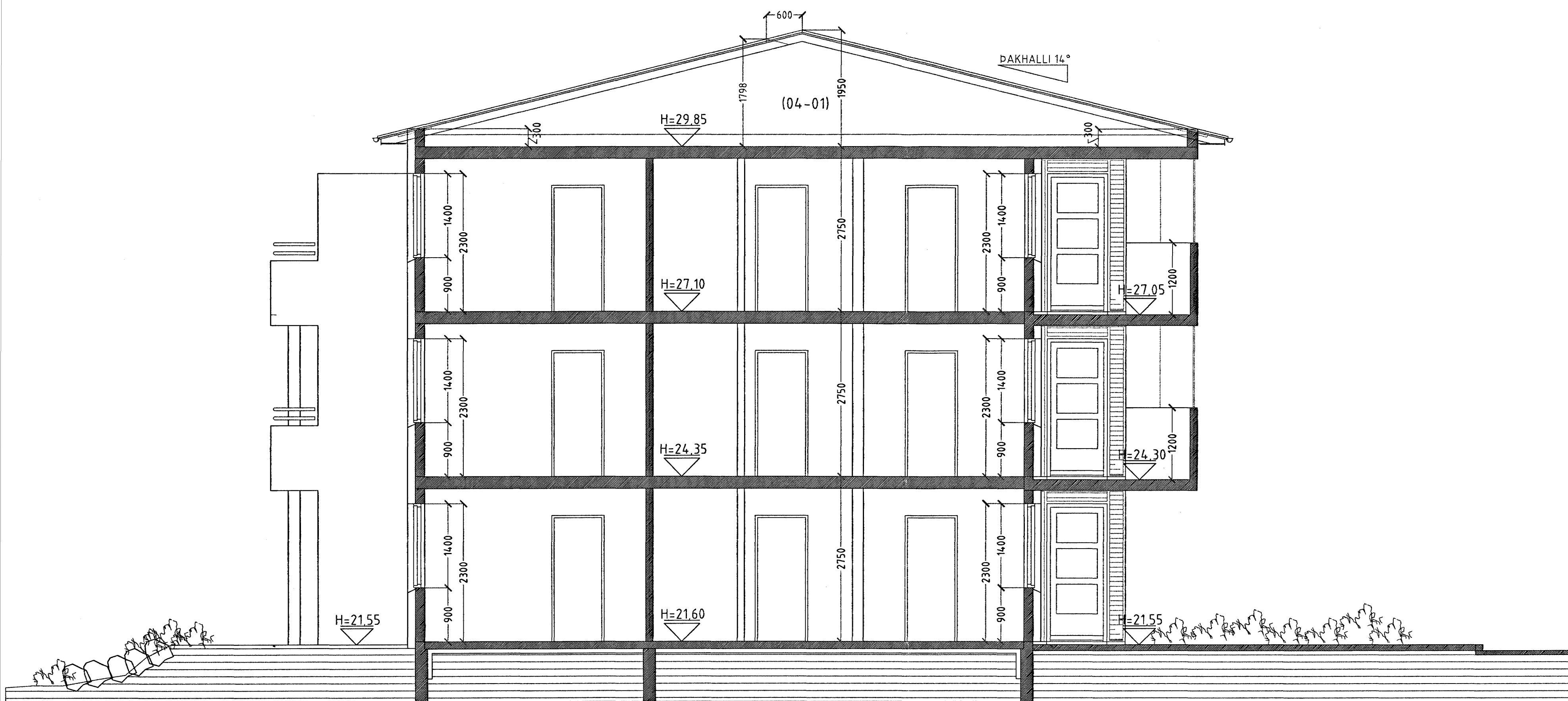
SNID A-A MKV. 1:50.