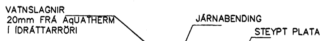
LAGNIR, SNIÐ, 1:20

NEYSLUVATNSLAGNIR ERU AQUATHERM 20mm Í IDRÁTTARRÖRI EINGÖNGU SKAL NOTA LAGNAEFNI VÐURKENNT AF RANNSÓKNARSTOFNUN BYGGINGARÍÐNÁÐARINS. LAGNIR, TENGDÓSIR OG DEILIGRINDUR SKULU VERA FRÁ SAMMA FRAMLEIÐANDA OG PASSA SAMAN. SETJA SKAL FESTINGAR Á LAGNIR c/c 150 cm, VÐ BEYGJUR SKAL SETJA 3 FESTINGAR. BEYGJURRADIUS SKAL ÁVALLT VERA STÆRRI EN 5 * YTRA ÞVERMÁL PÍPNA. ÞRÝSTIÞRÖFUN Á PLASTLÖGNUM SKIPTIST Í 2 LOTUR FYRRI LOTA ER FRAMKVÆMD Í 1 KLUKKUSTUND OG ER ÞRÝSTINGUR 15 BAR FYRIR NEYSLUVATN. SEINNI LOTAN ER GERÐ Í BEINU FRAMHALDI AF FYRRI LOTU OG SAMI ÞRÝSTINGUR NOTAÐUR SEINNI LOTAN SKAL STANDA Í 2 KLUKKUSTUNDIR. FYLLA SKAL ÓT ÞRÖFUNARBLAÐ SEM SÝNIR NIÐURSTÖÐUR ÞRÖFUNAR.