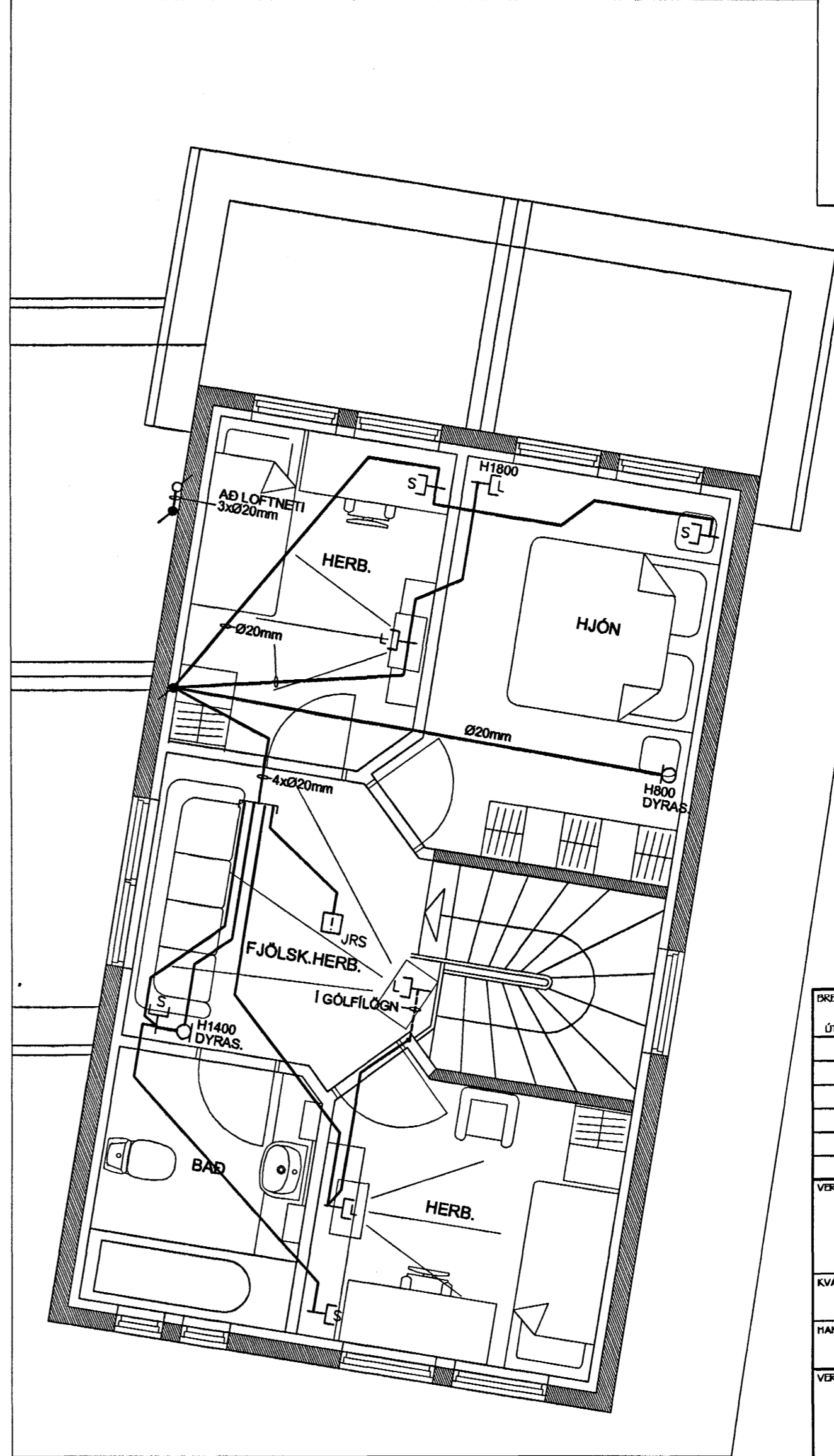
GRUNNMYND 2. HÆÐ, MKV. 1:50