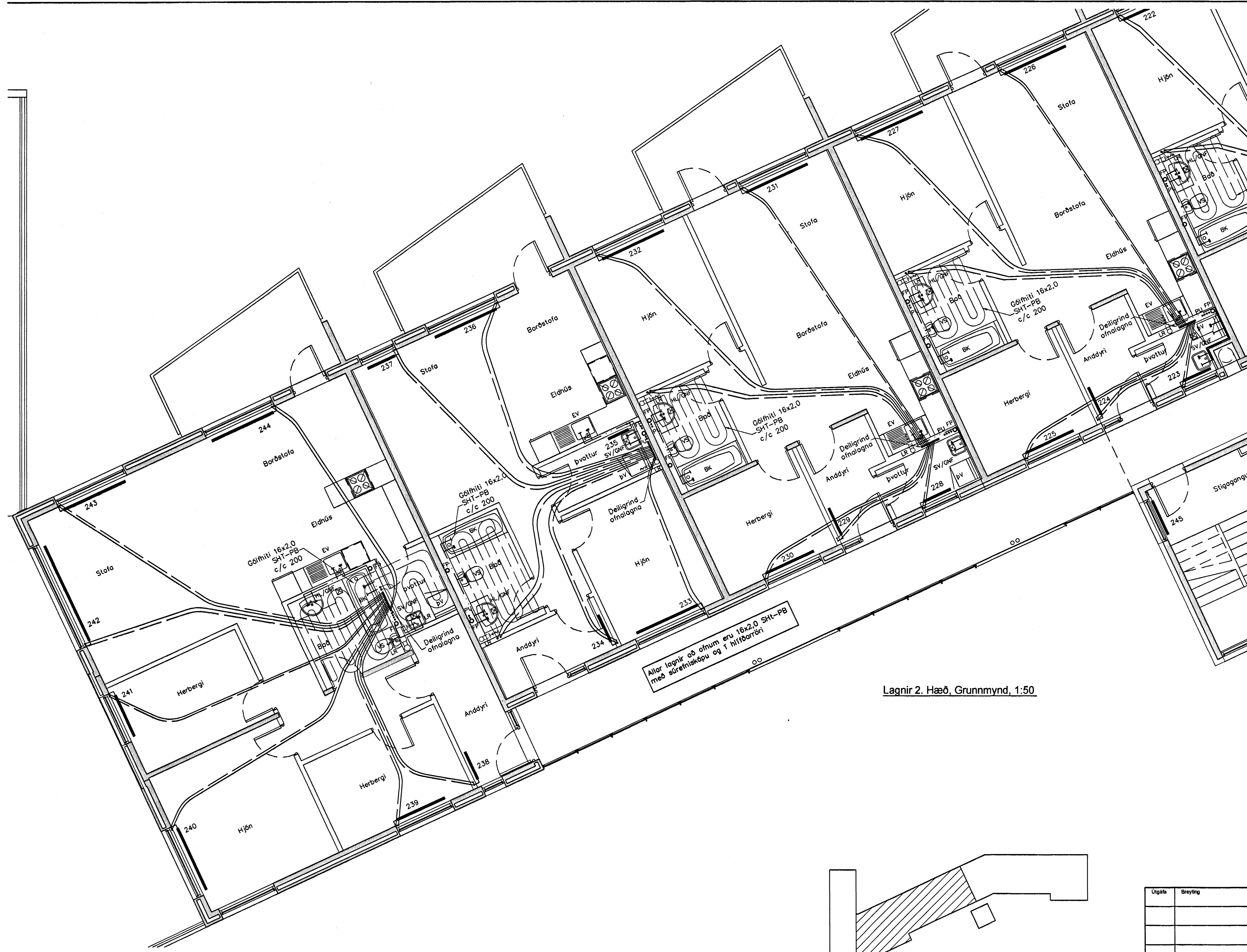
Lagnir 2. Hæð, Grunnmynd, 1:50