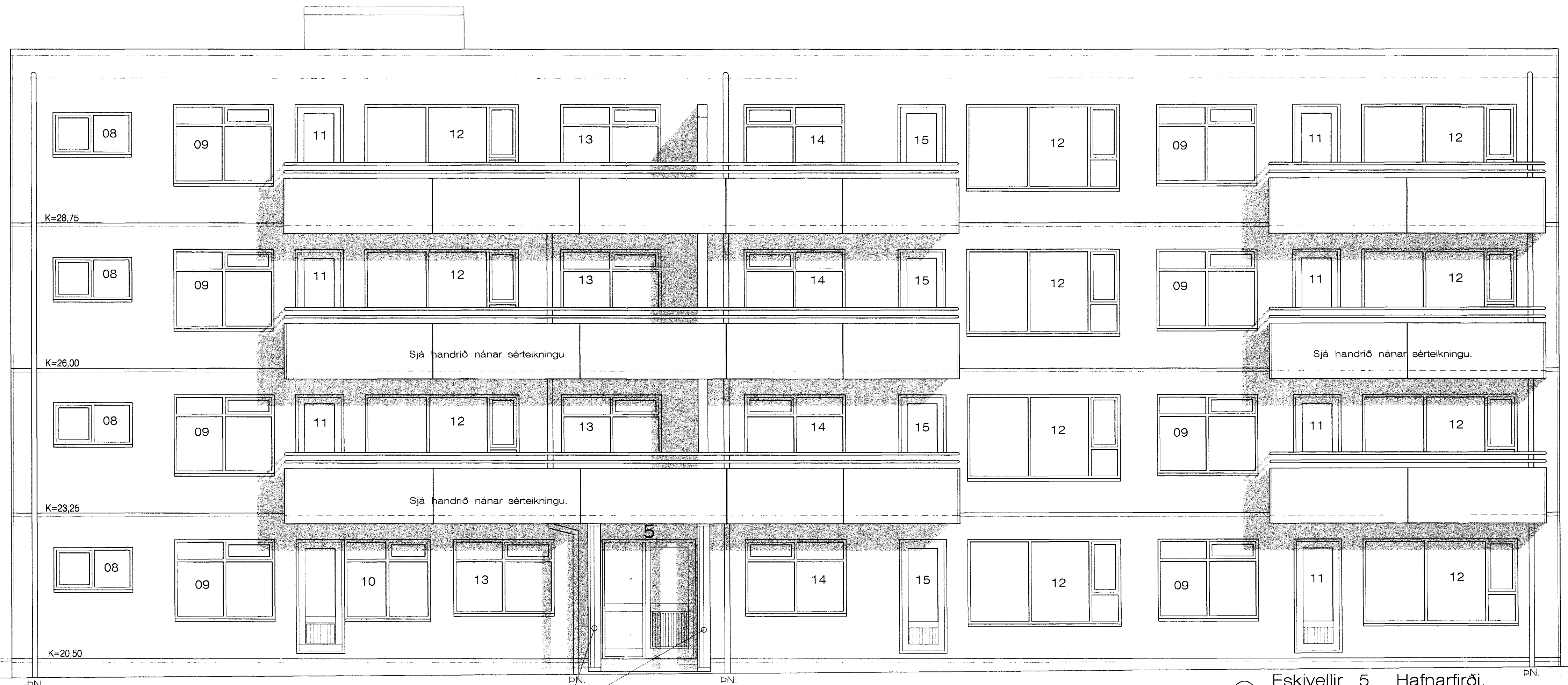
Vesturhlíð að götu. 1:50