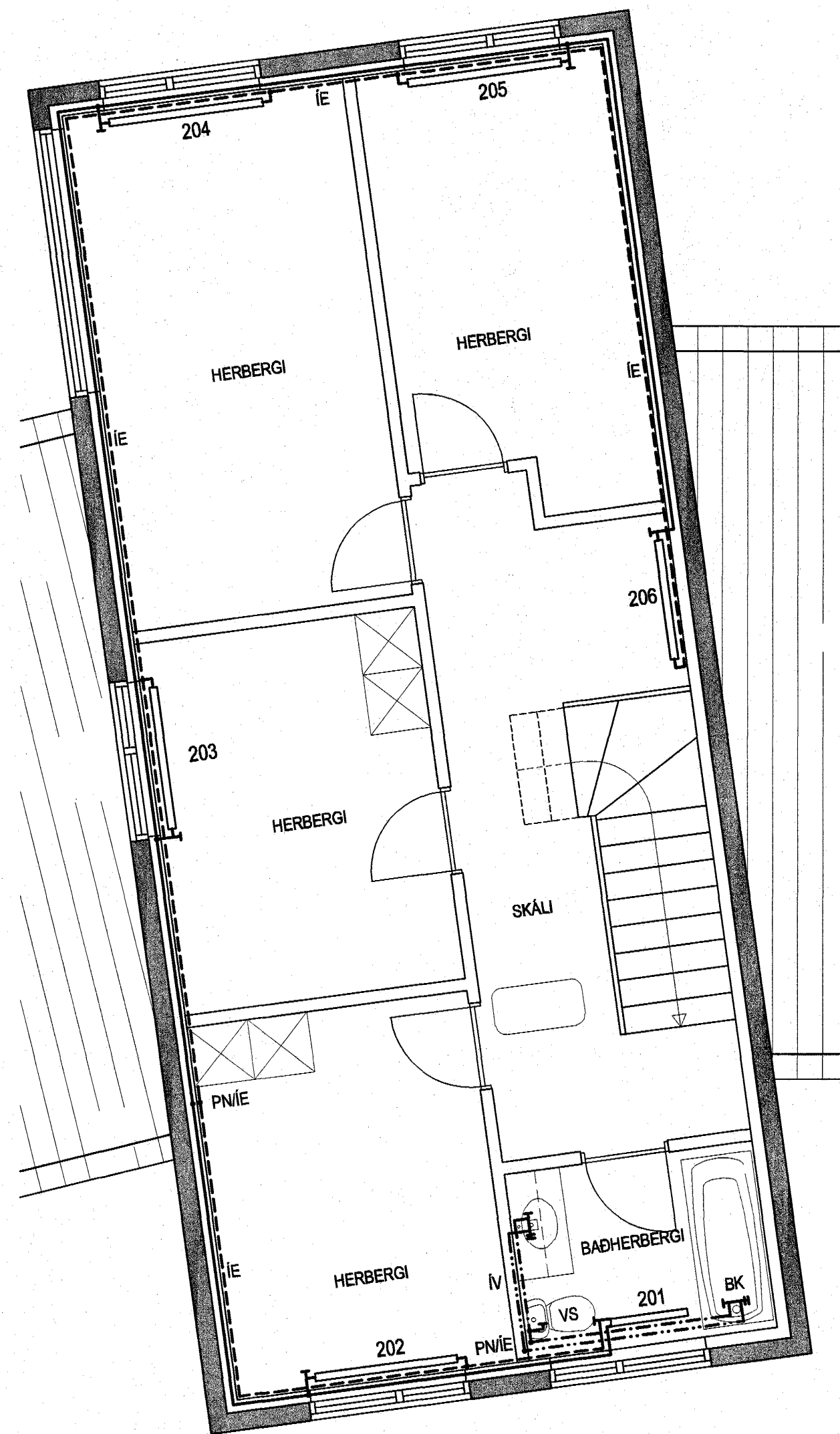
FÍFUVELLIR 15 NEYSLUVATNS- OG HITALAGNIR GRUNNMYND EFRI HÆÐAR MKV. 1:50