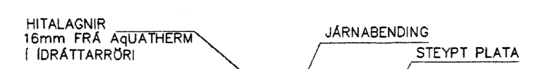
LAGNIR, SNID, 1:20