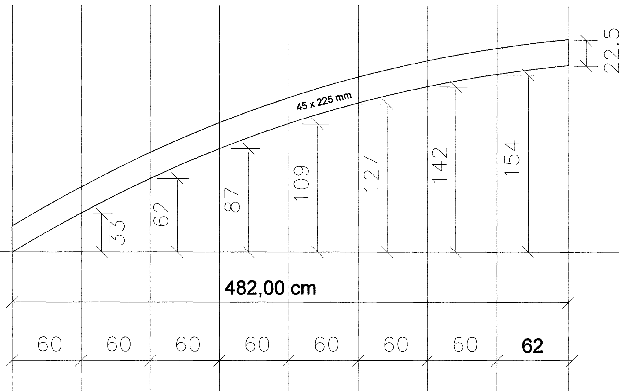
Kertosperra gerð - 3.

Byggingafulltrúi Hafnarfjarða Afgreitt þann 05 JULI 2004 Hó