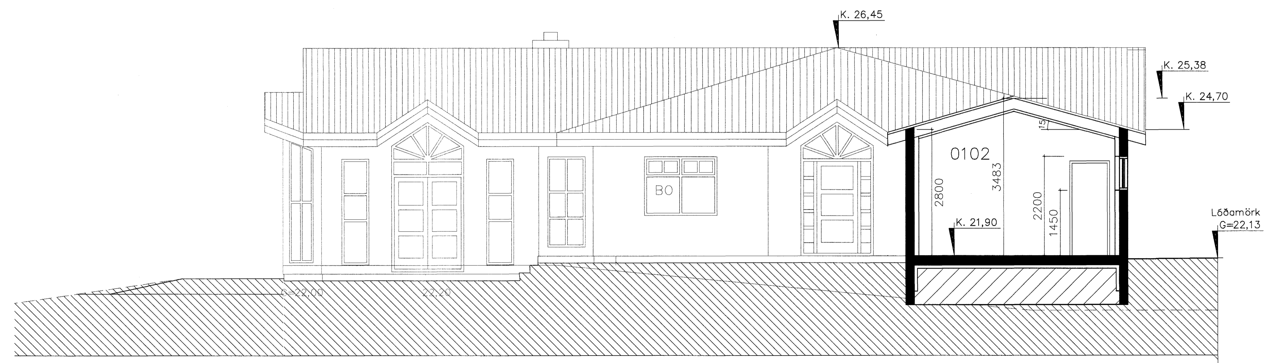
Mkv. 1:50 - SNIÐ Snið C-C Bílgeymsla 1 :100

Samþykkt bann 28 MAI 2004 Byggingaútlitinn í Hafnarfirði E.h. Sigurbjartur Halldórsson