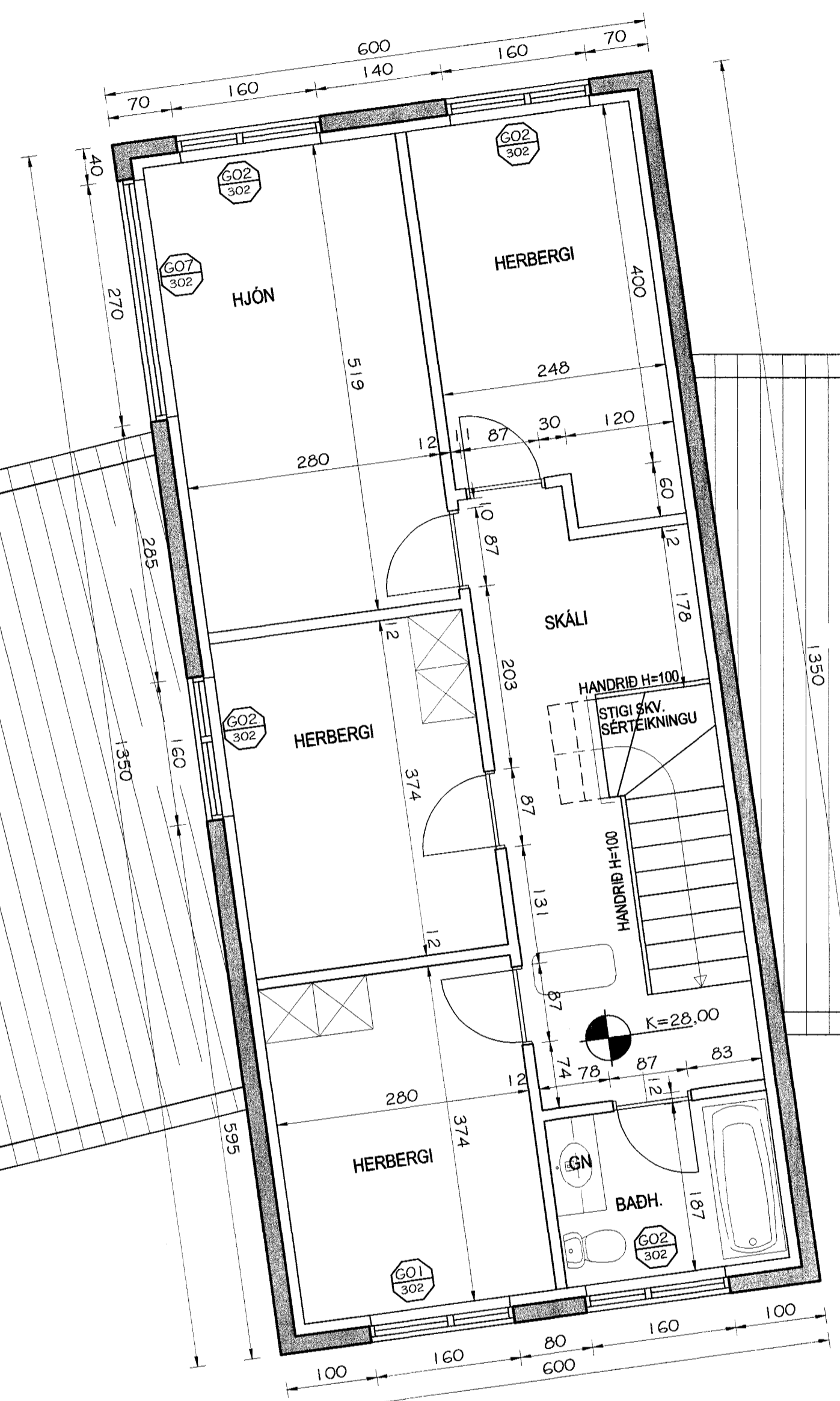
FÍFUVELLIR 15 MKV. 1:50