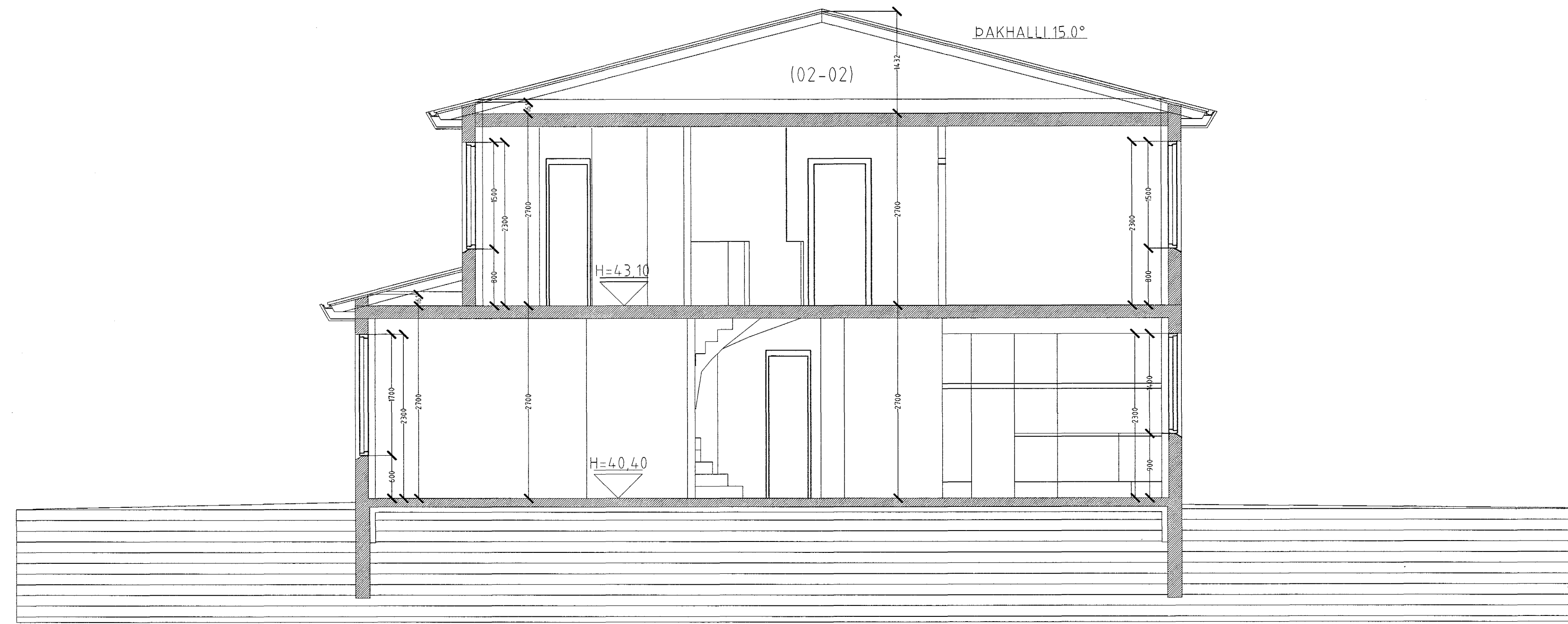
SNID A-A MKV. 1:50.