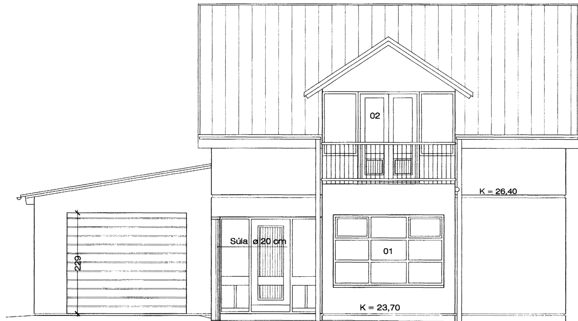
SUÐVESTURHLIÐ M 1 : 50