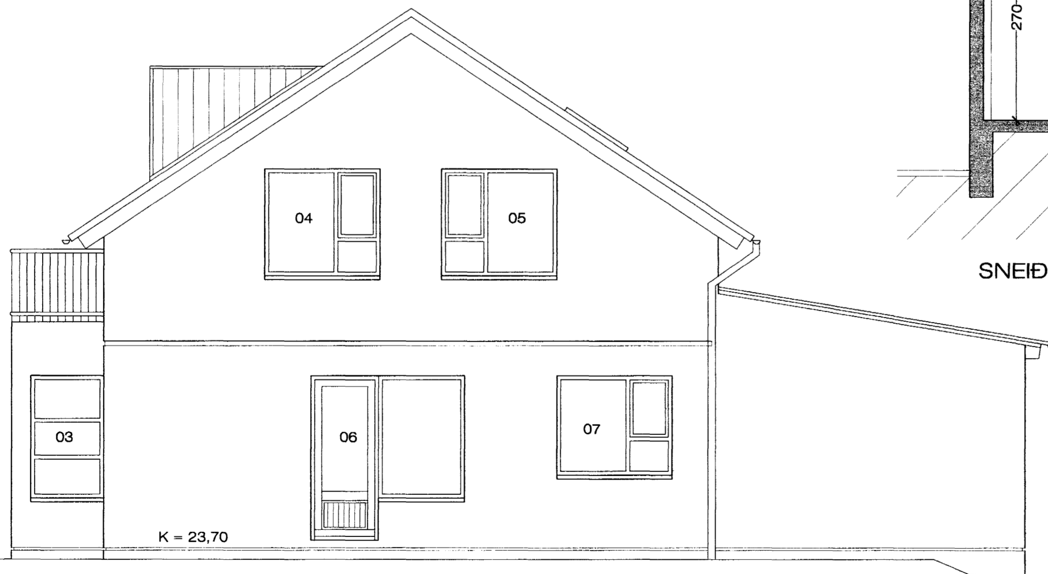
NORÐAUSTURHLIÐ M 1 : 50

Byggingafulltrúi rannsóknar Afgreitt þann 29 APR. 2003