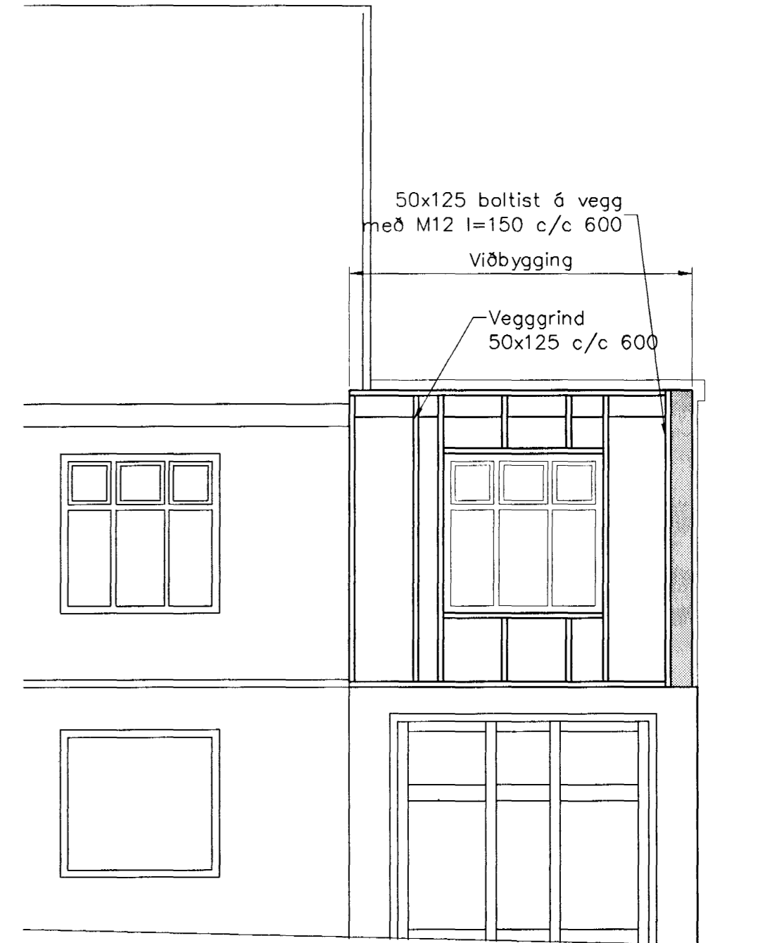
Ásýnd vestur, 1:50