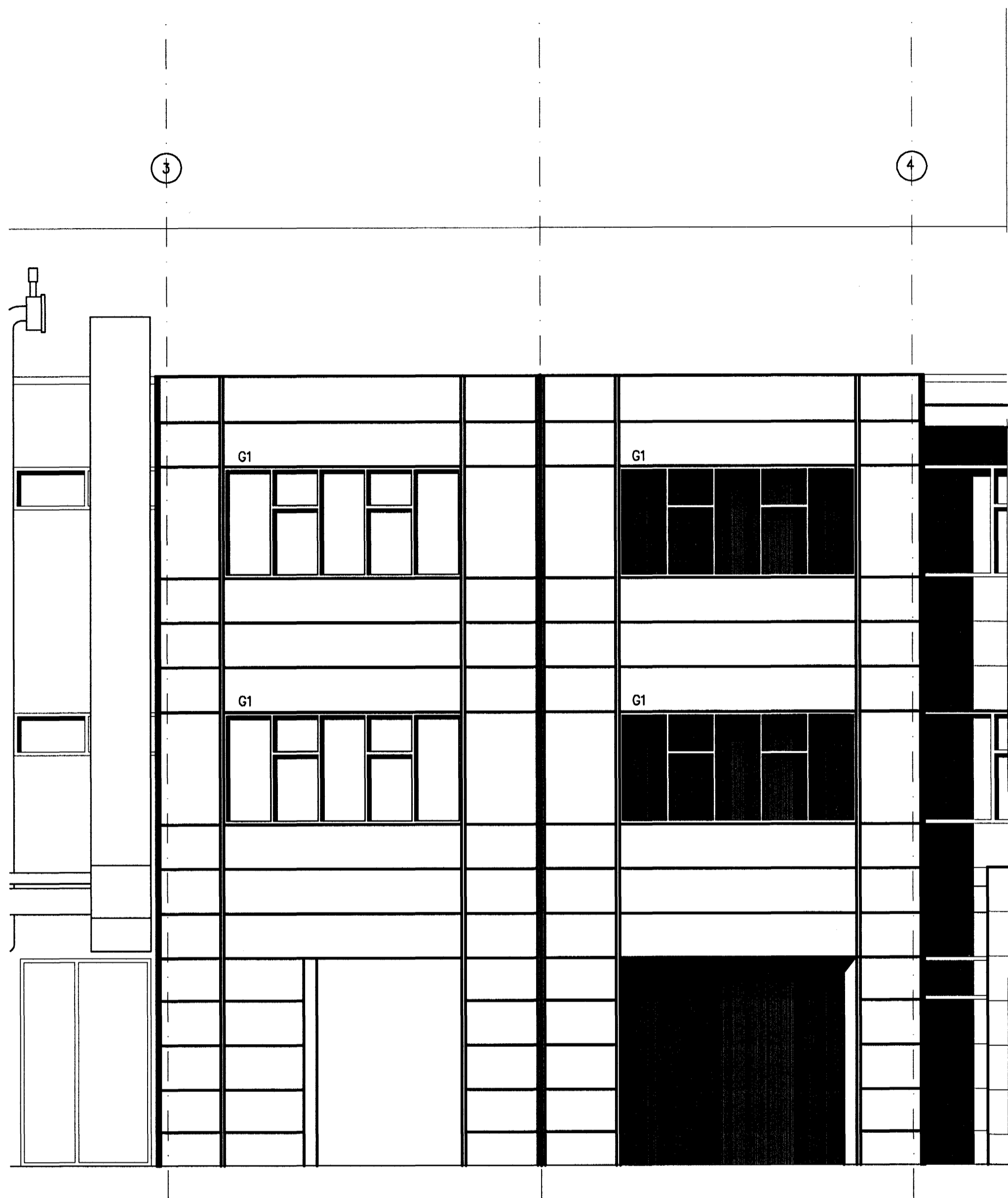
Nýbygging nr. 1, ásýnd