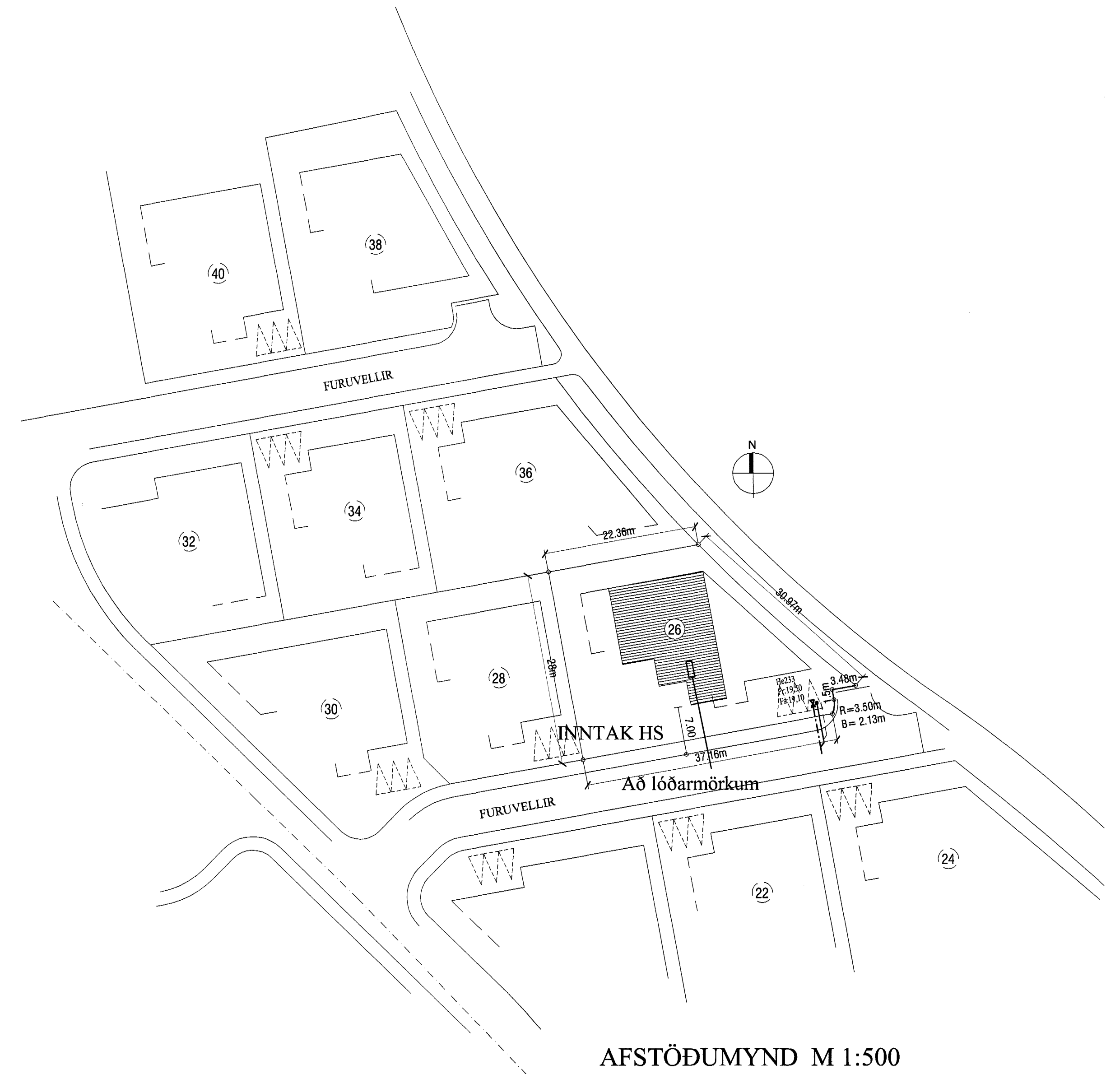
AFSTÖÐUMYND M 1:500