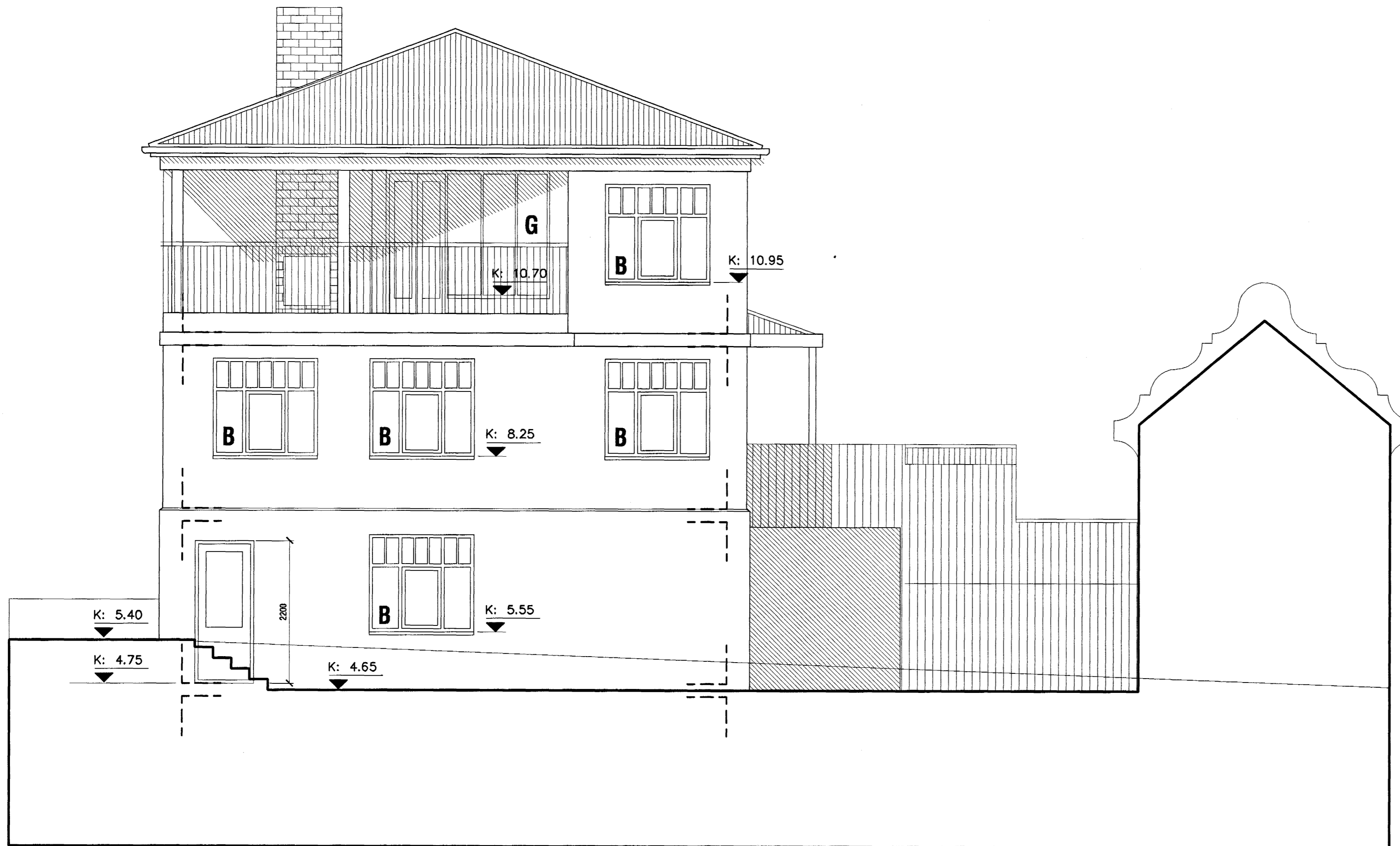
Ásýnd suð-vestur mkv. 1:50