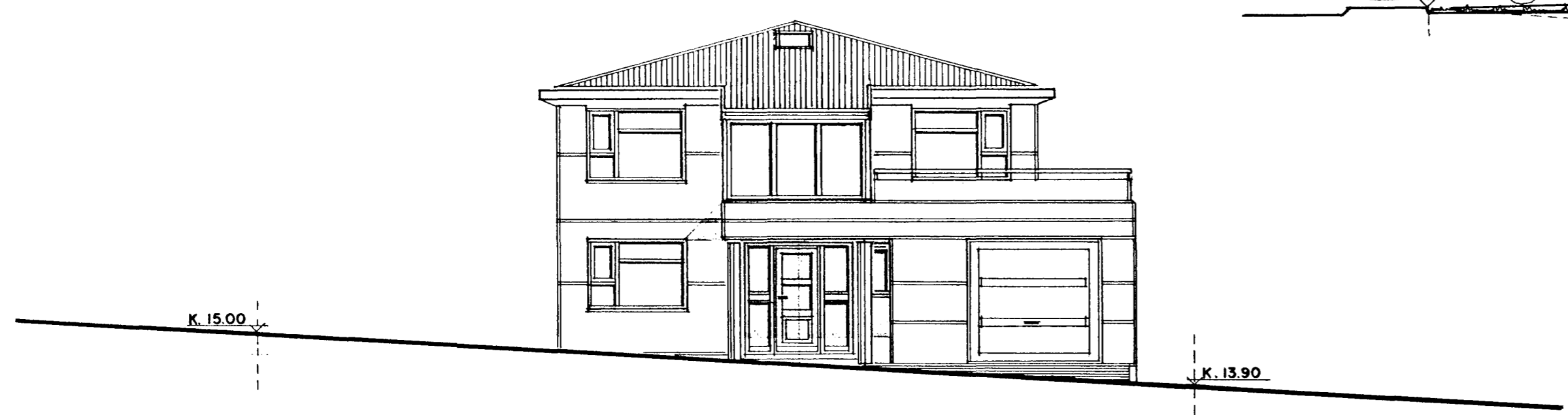
SNEIÐING Í HAMARSBRAUT. 1:100

BREYTT 30.-8.-2002 SÓLSTOFA Á AUSTURHLIÐ. OG HANDRÍÐ Á SVALIR. Jón Guðmundsson.