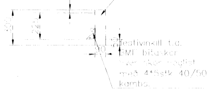
snúð b 1/20