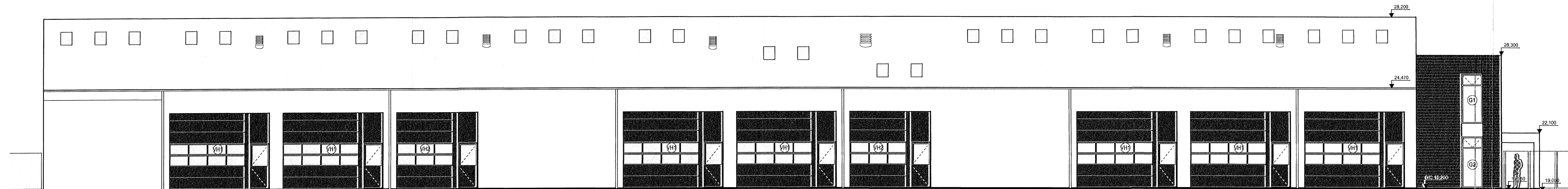
ÚTLIT VESTUR MKV 1:100