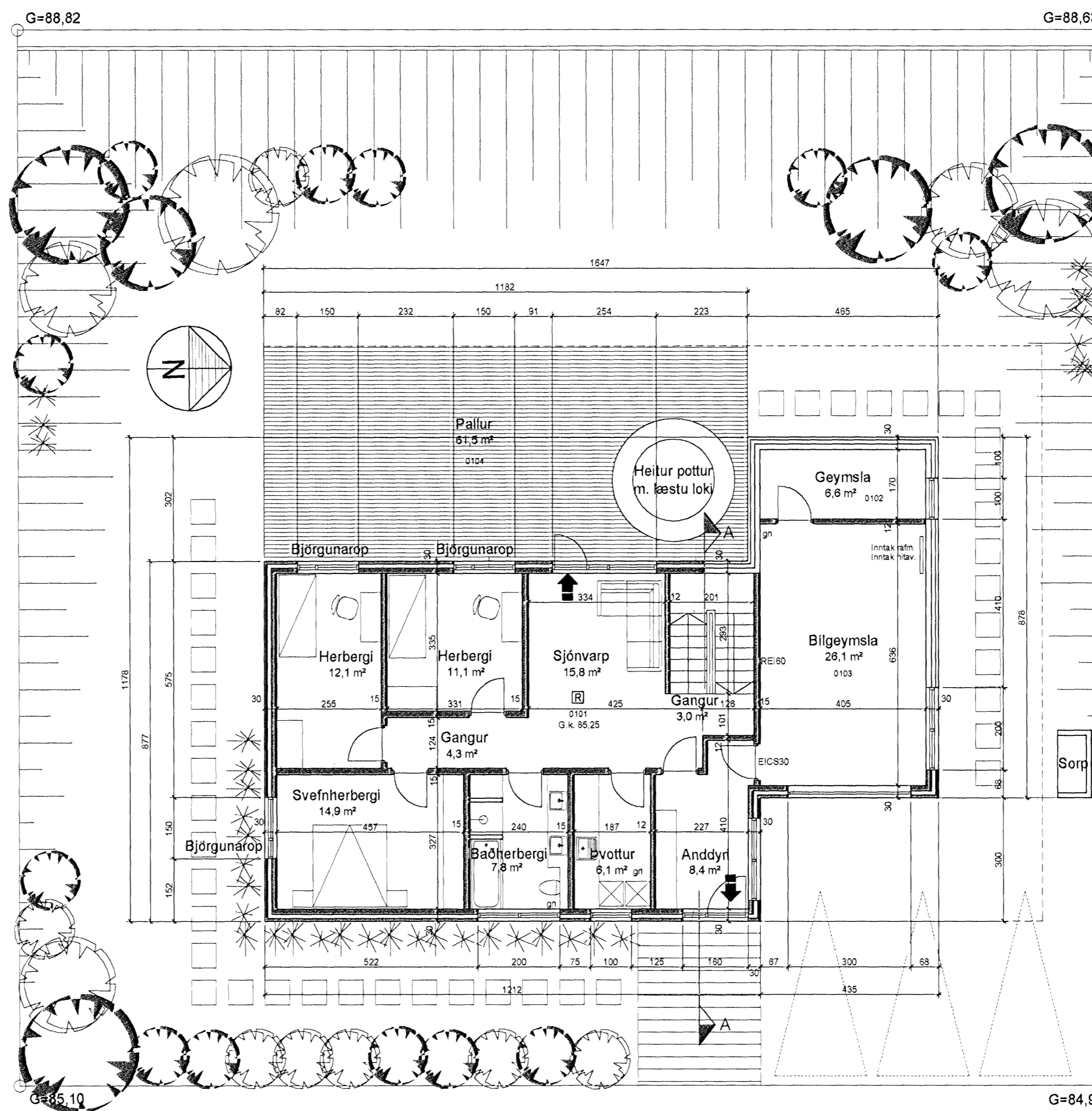
Grunnmynd 1. hæðar 1:100