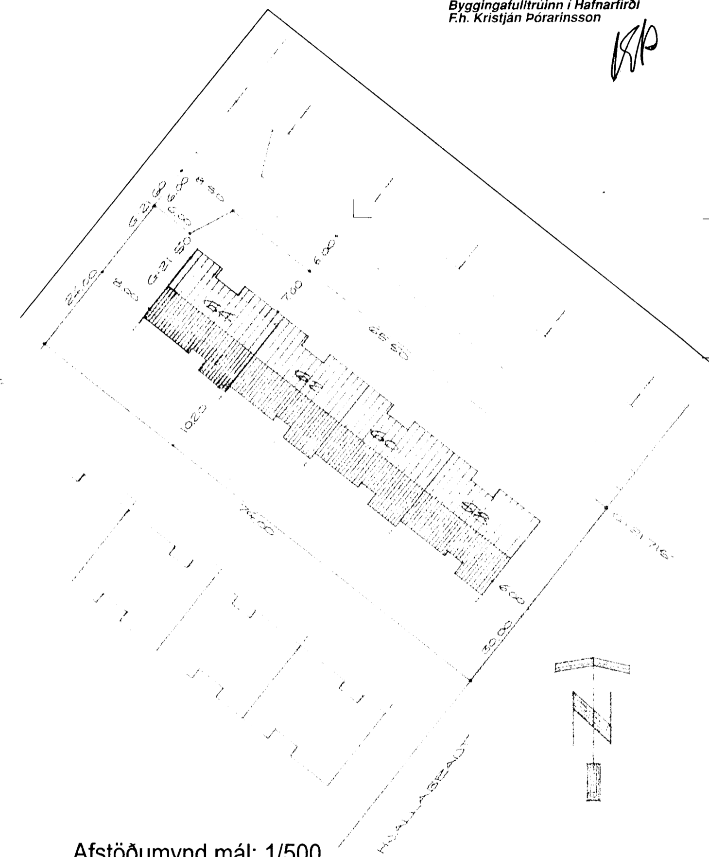
Afstöðumynd mál: 1/500