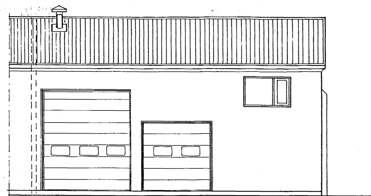
BREYTT ÚTLIT Á VESTURHLIÐ

tifftopdf - www.rubissoftware.com - Demo Version