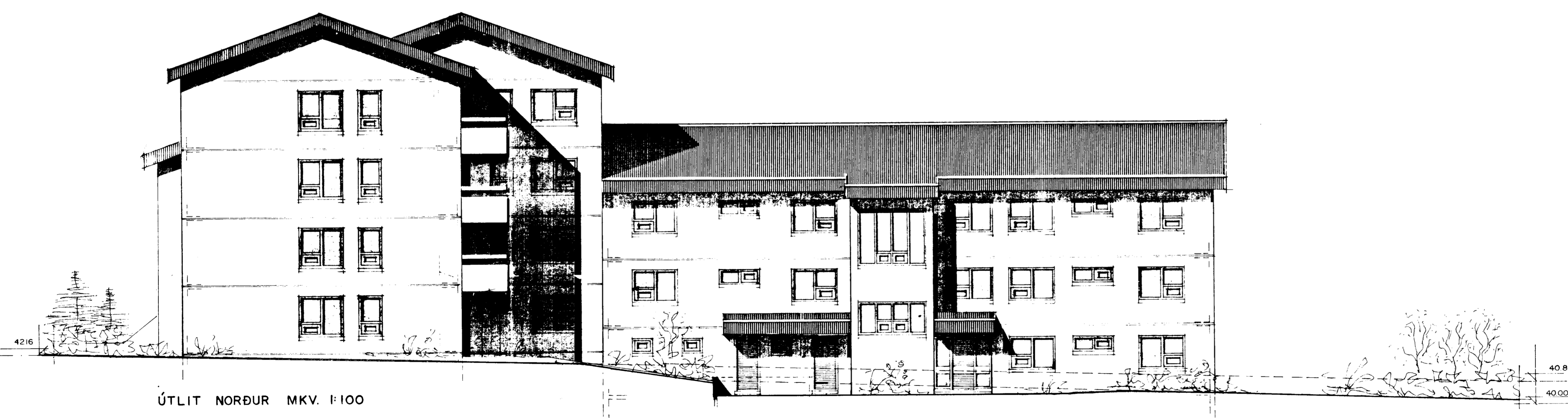
ÚTLIT NORÐUR MKV. 1:100