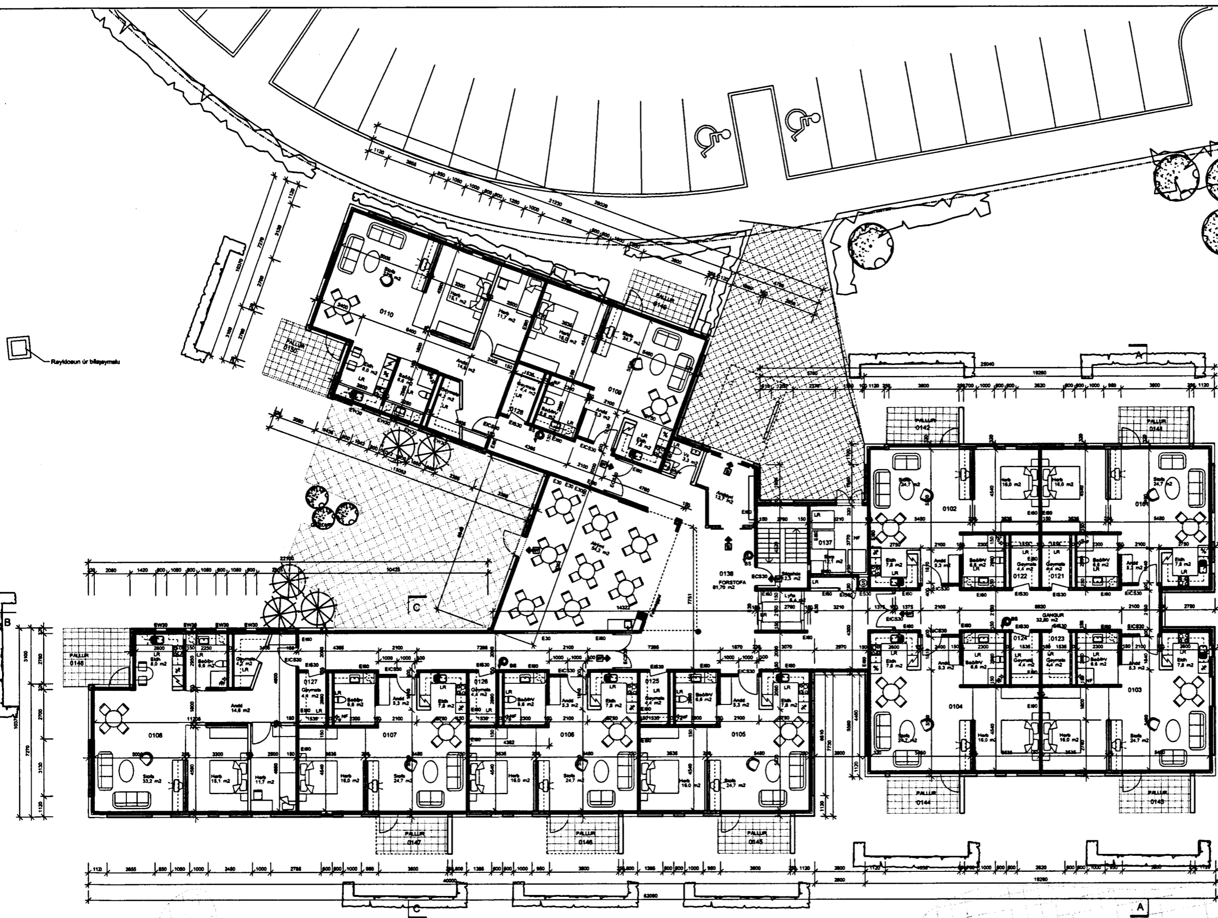
GRUNNMYND 1.HÆÐ 1:100