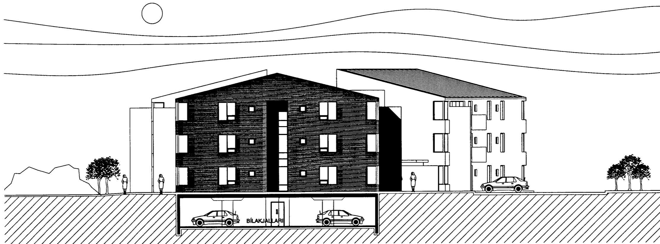
HRAUNVANGUR 3 ÚTLIT NORÐUR 1:100

Byggingatulltrúinn í Hafnarfirði Erlendur Hjálmarsson