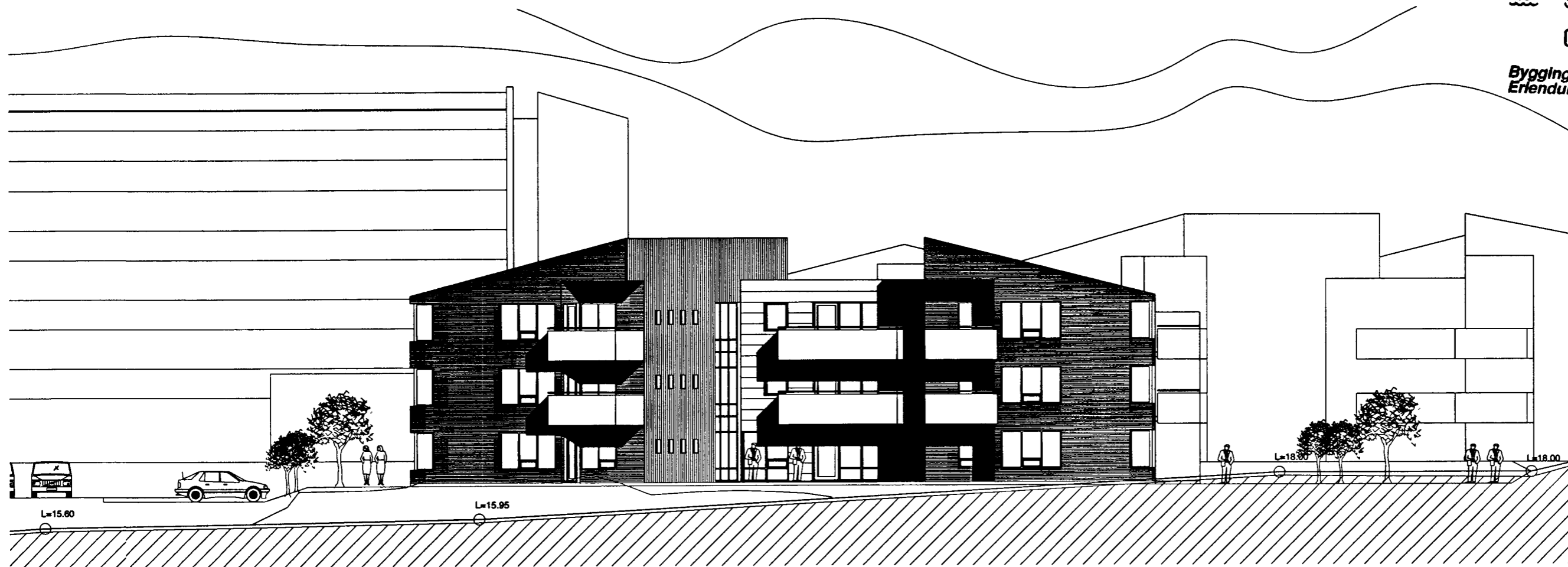
HRAUNVANGUR 3 ÚTLIT SUÐUR 1:100

Byggingafultrúinn í Hafnarfirði Erlendur Hjálmarsson