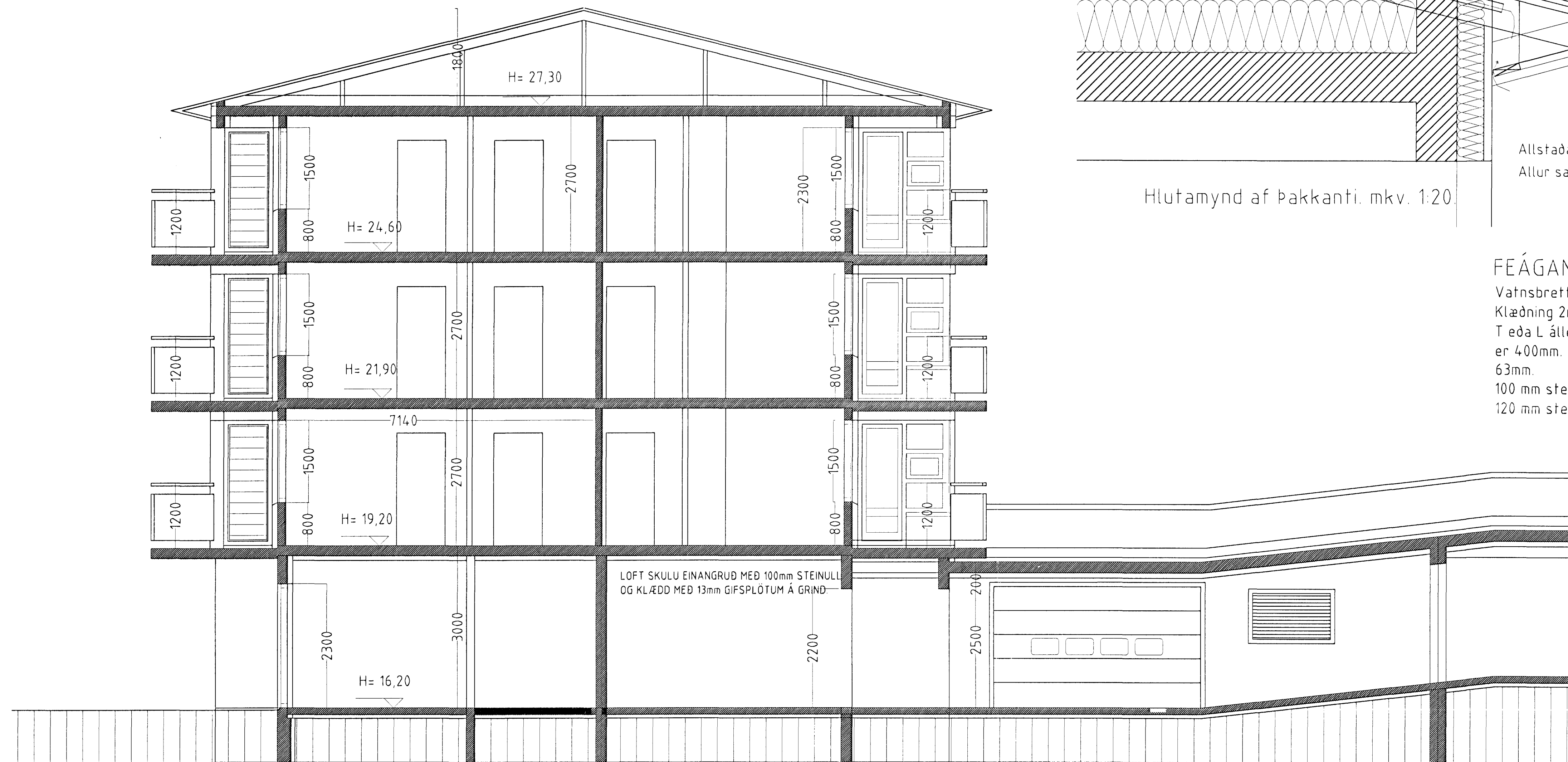
SNID. A-A. mkv. 1:50.

ATH. Vísad er til teikninga verkfræðings hvað varðar festingar og stærðir burðarvirkis.