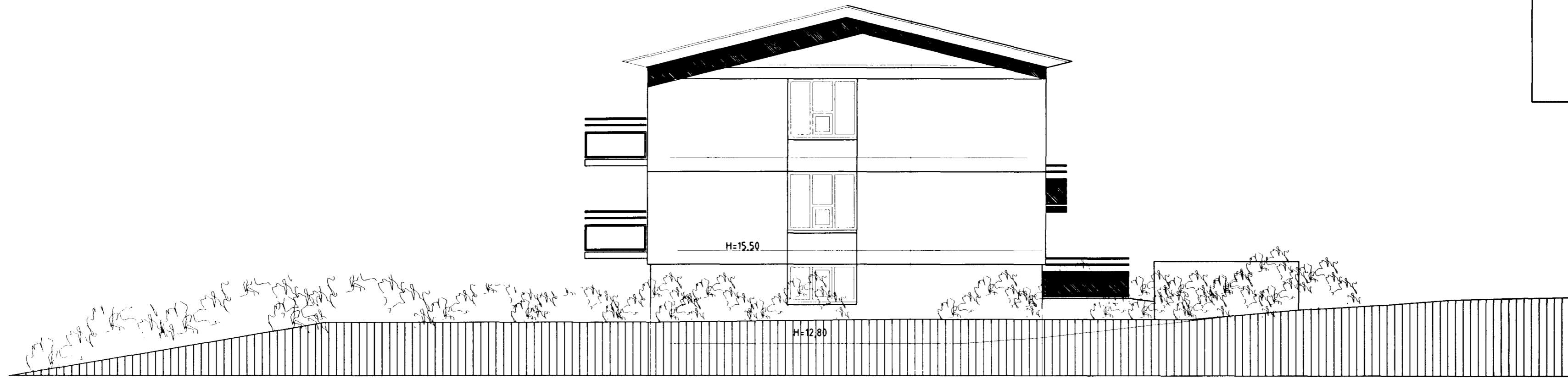
ÚTLIT SUÐUR m.k.v. 1:100