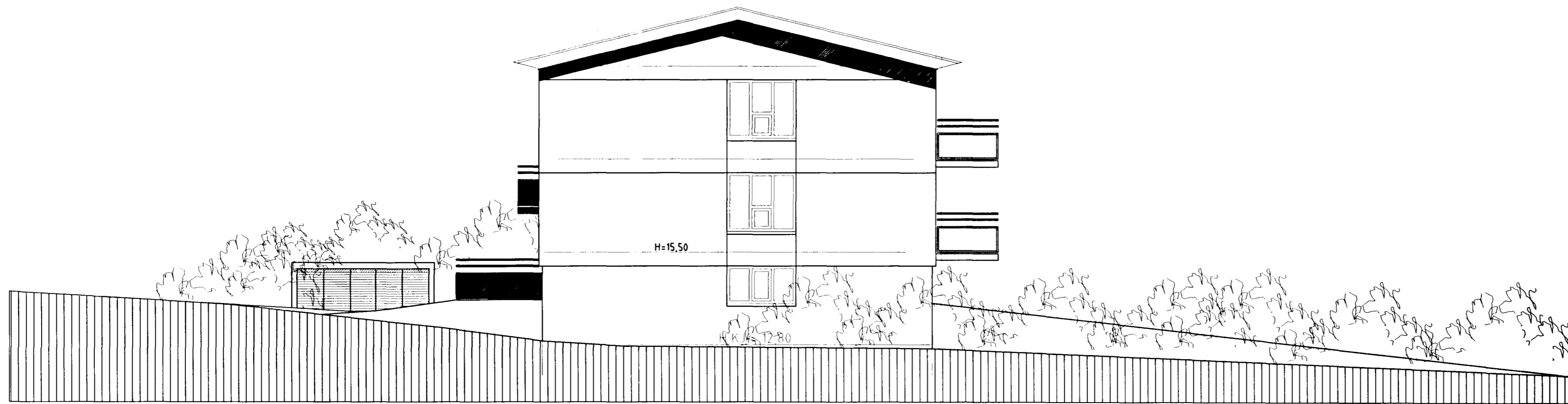
ÚTLIT NORÐUR m.k.v. 1:100