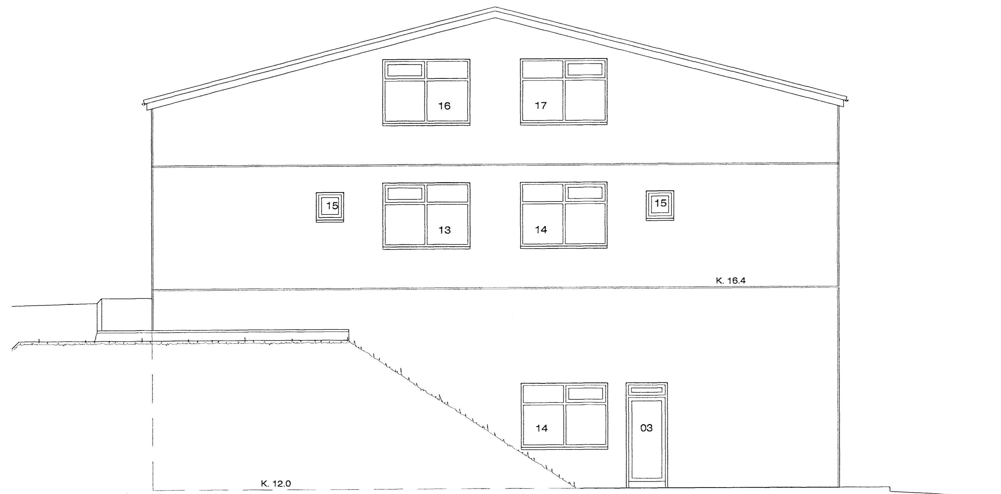
NORÐAUSTURHLIÐ M 1 : 50