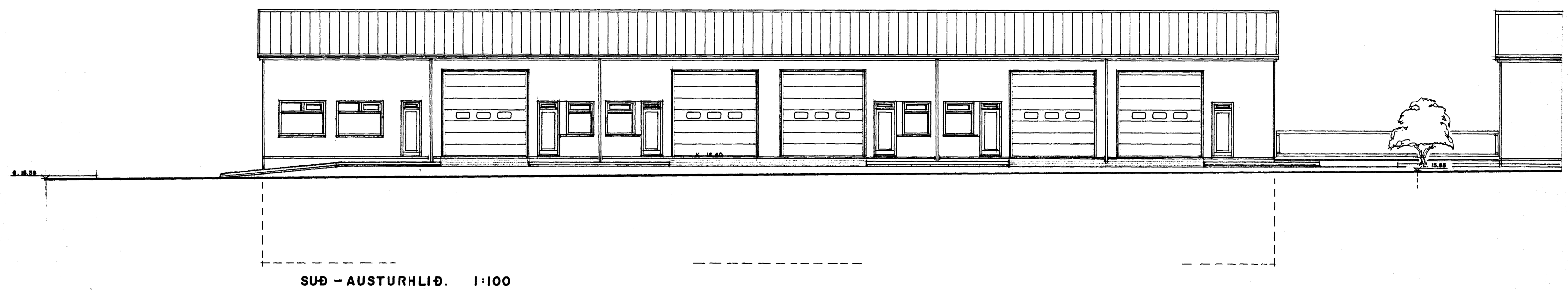
SUÐ - AUSTURHLIÐ. 1:100