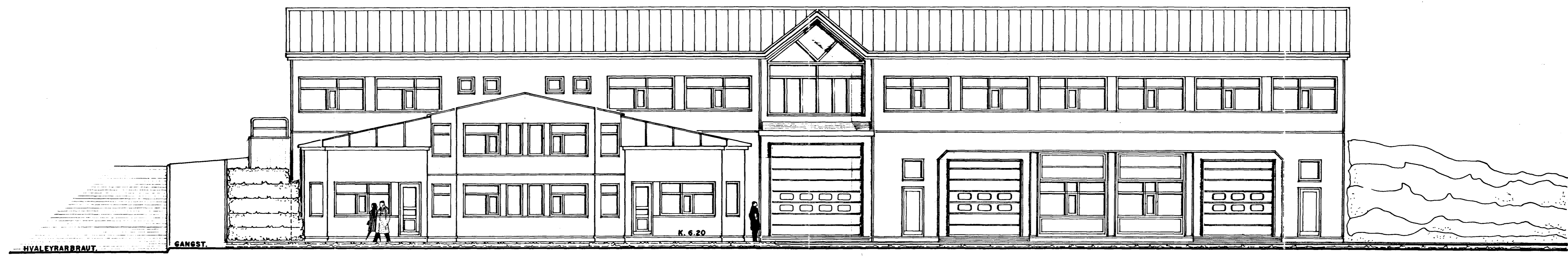
AUSTURHLIÐ. 1:100 AÐ FORNUBÚÐUM.