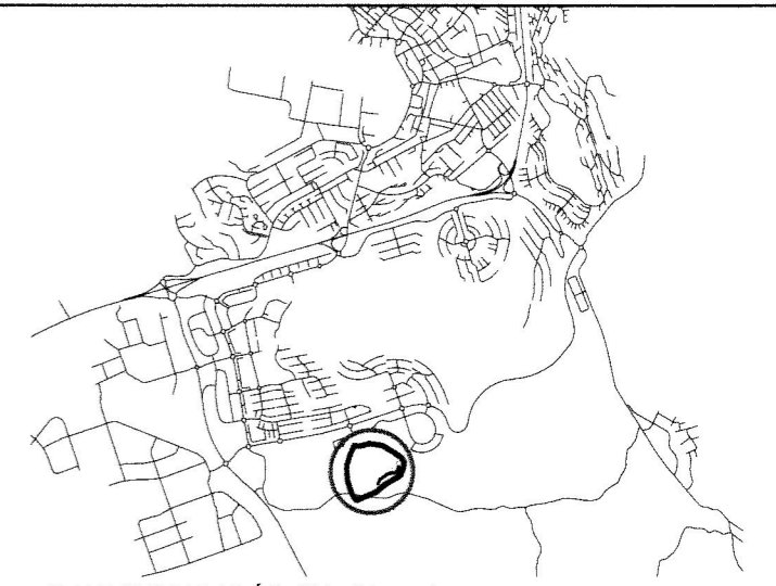
STAÐSETNING Í BÆJARLANDINU