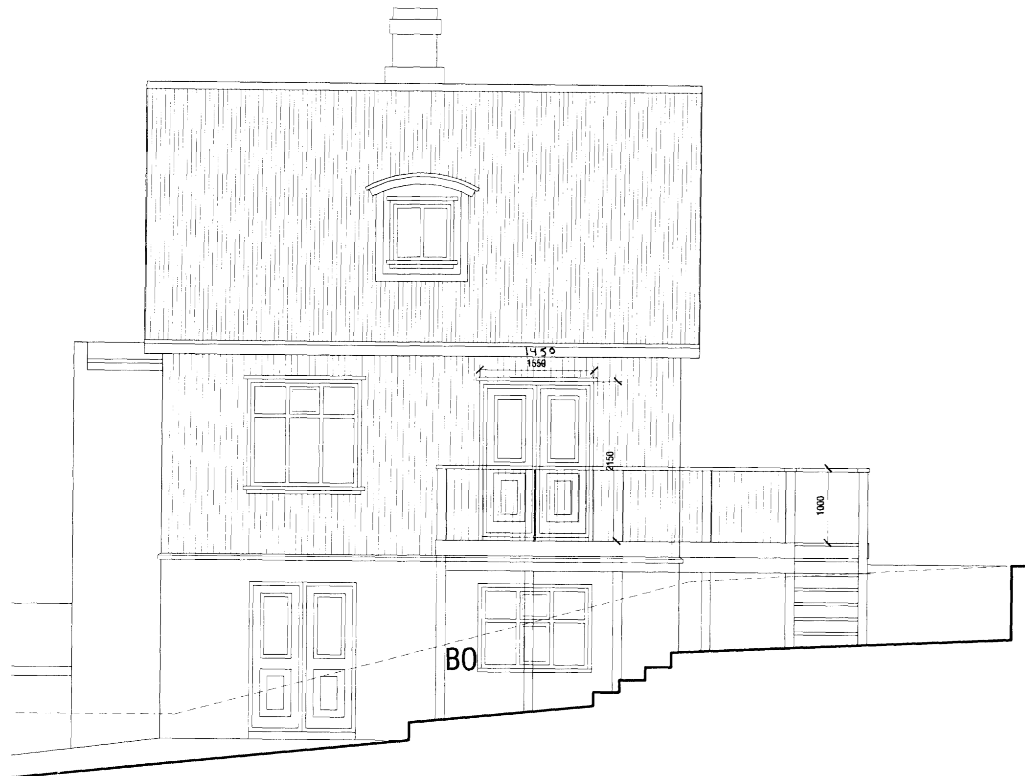
Ásýnd Vestur mkv. 1:50