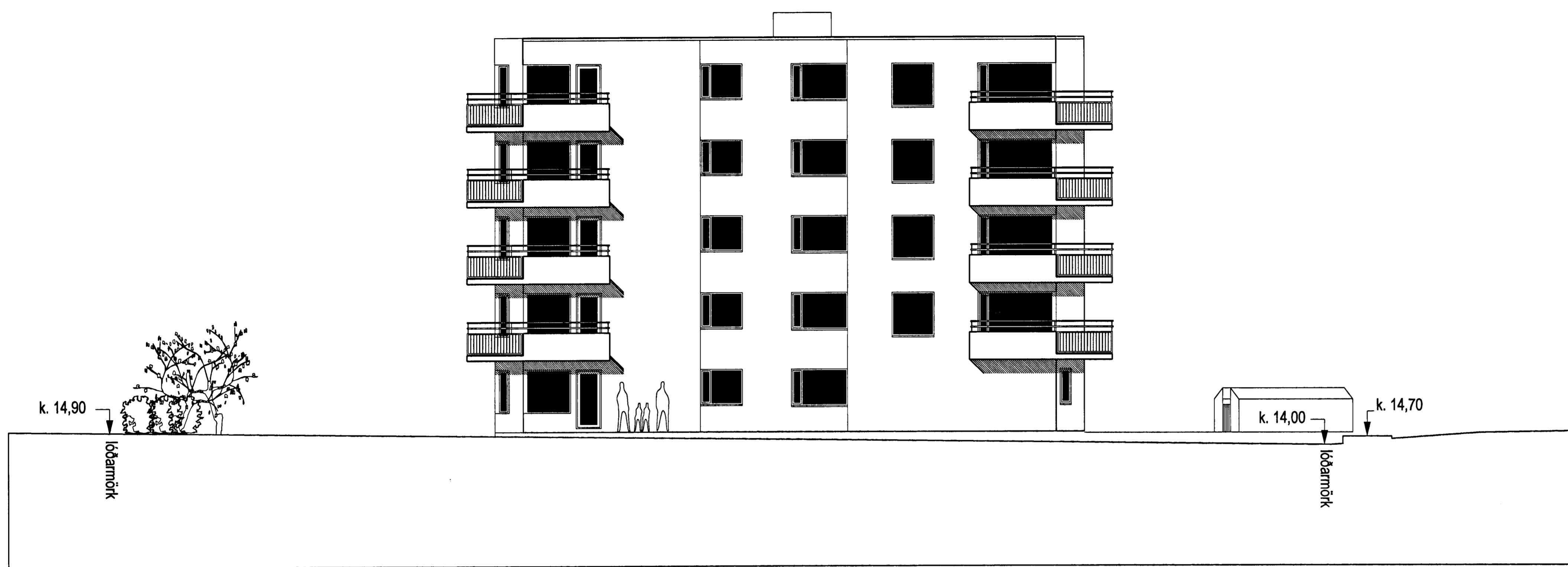
ÚTLIT 1:100 SUÐUR HLÍÐ