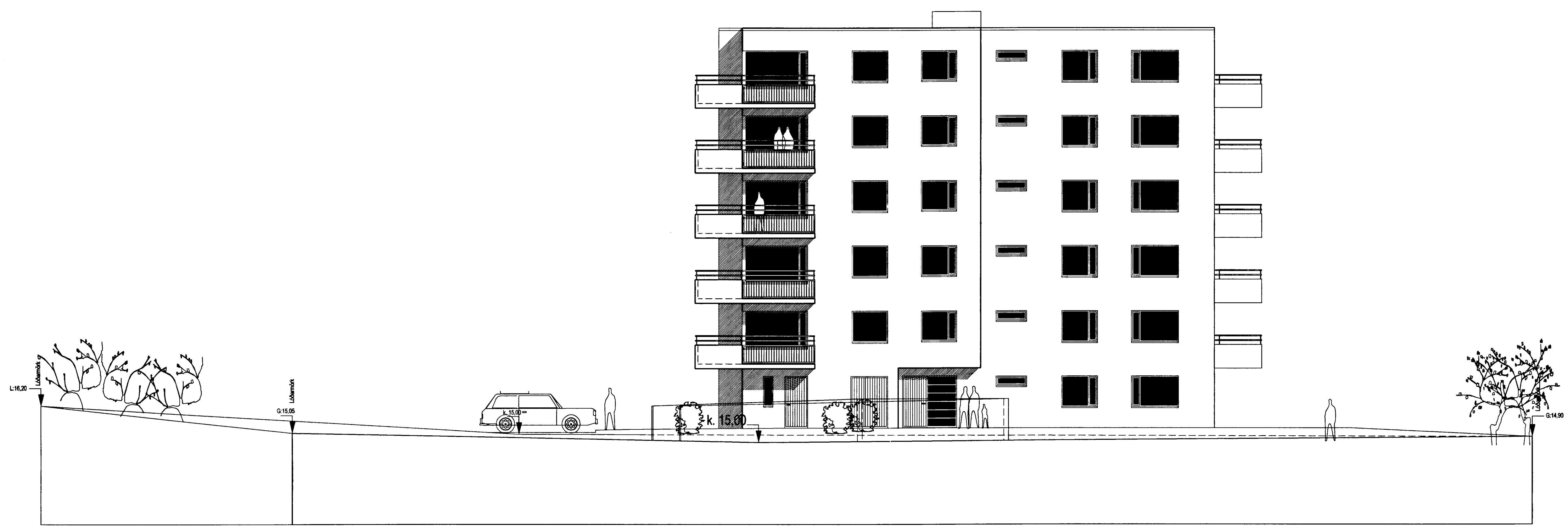
ÚTLIT 1:100 NORÐUR HLÍÐ