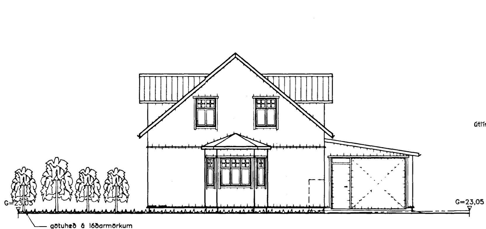
SUD-AUSTLÆG HLID mkv. 1:100