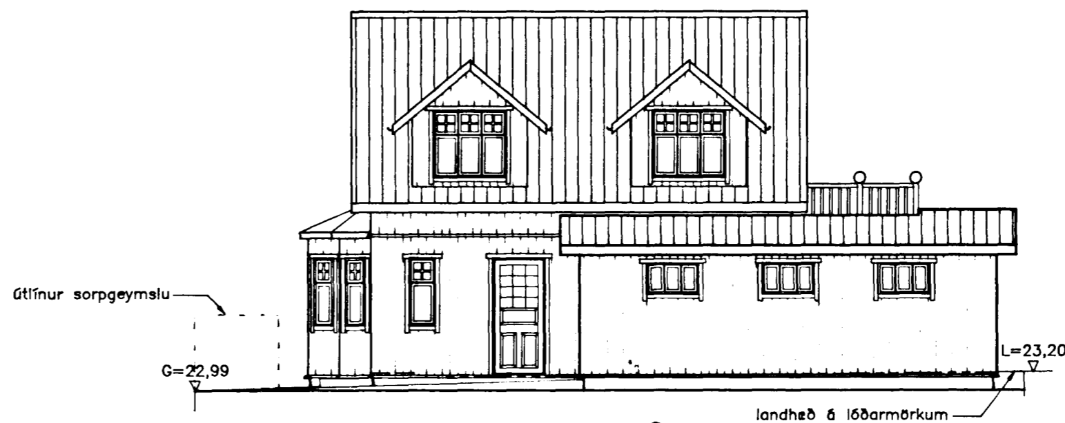
NORD-AUSTLÆG HLID mkv. 1:100