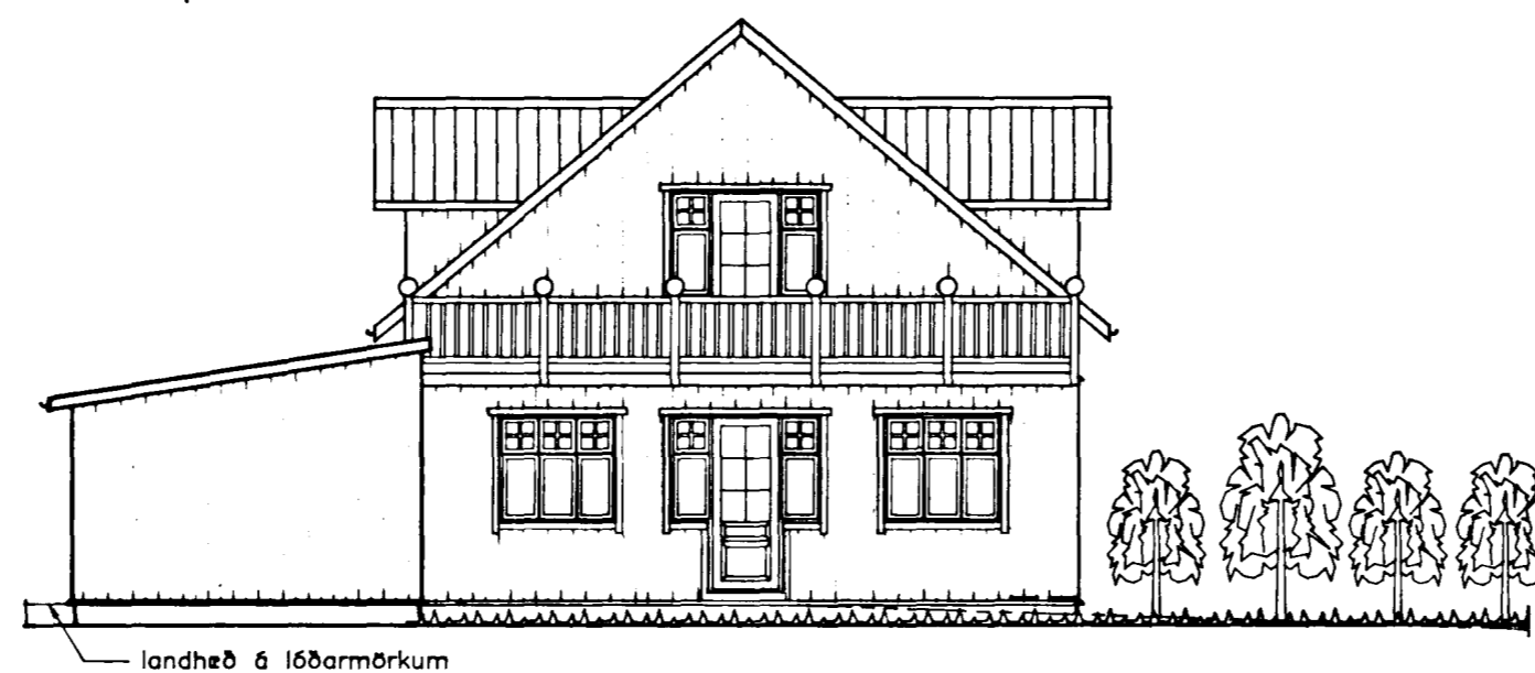
VESTLÆG HLID mkv. 1:100