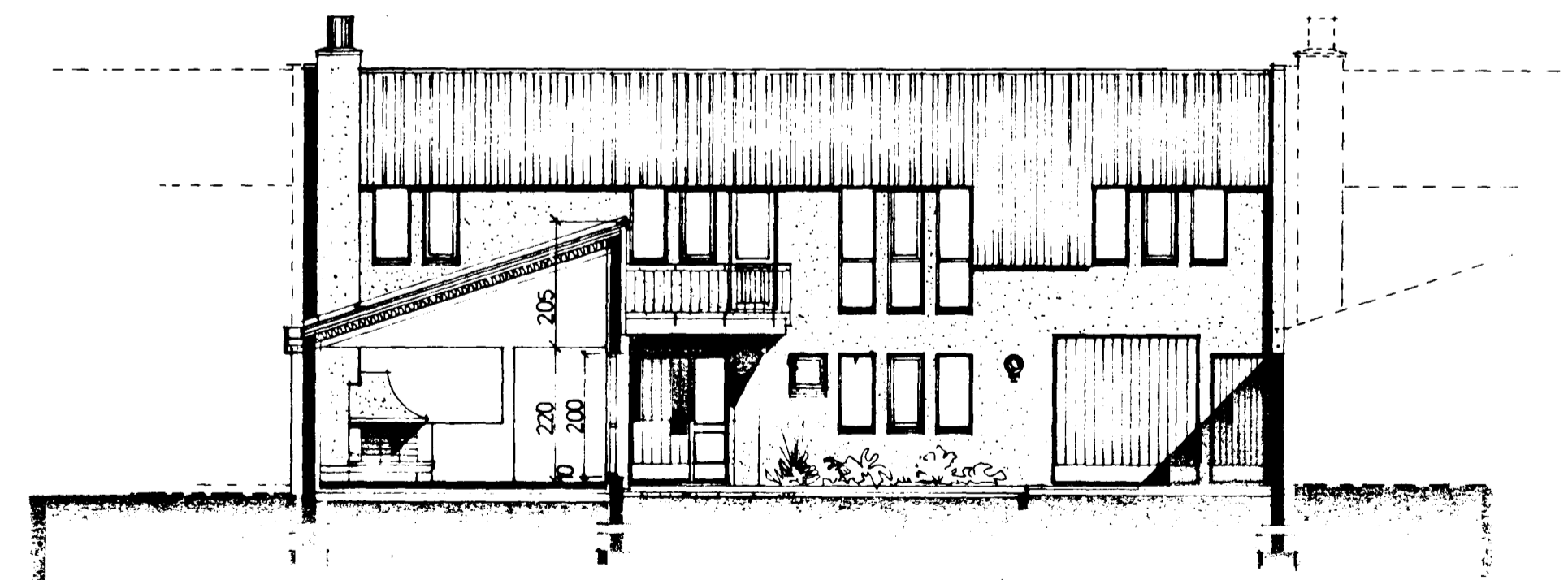
SNÍÐ B-B · M. 1:100