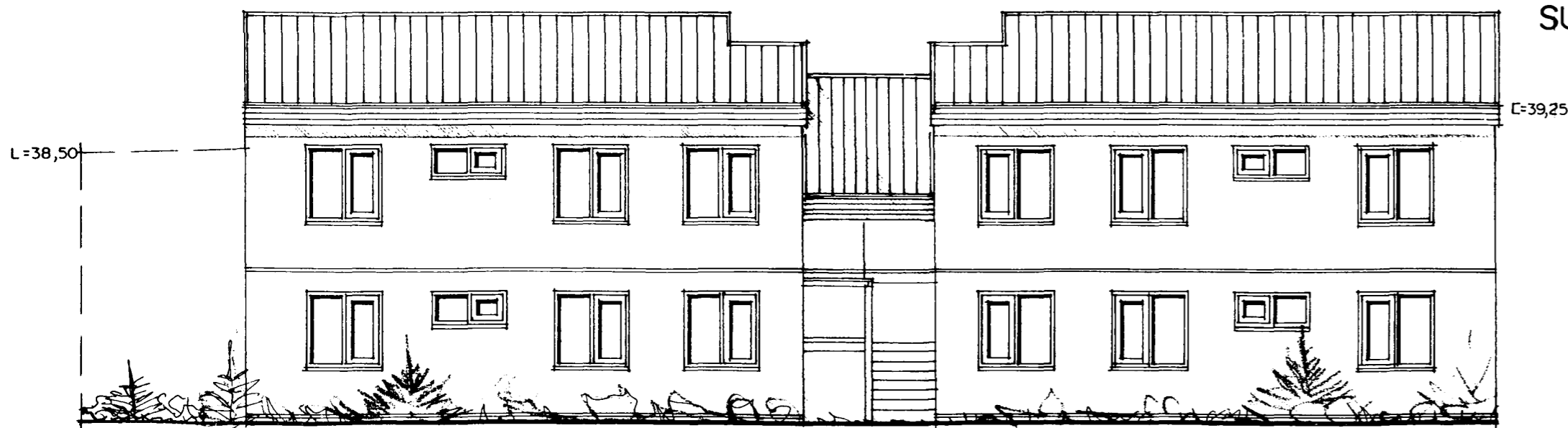
NORÐAUSTUR MKV. 1:100.