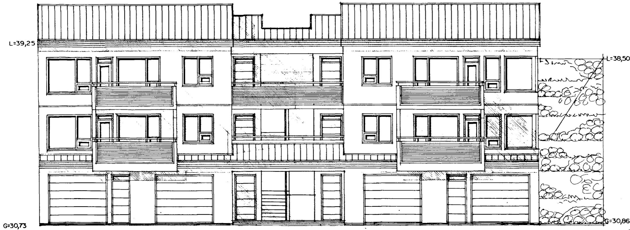
SÚDVESTUR MKV. 1:100.

Byggingatulltrunn í Hafnarfirði Erlendur Hjálmarsson