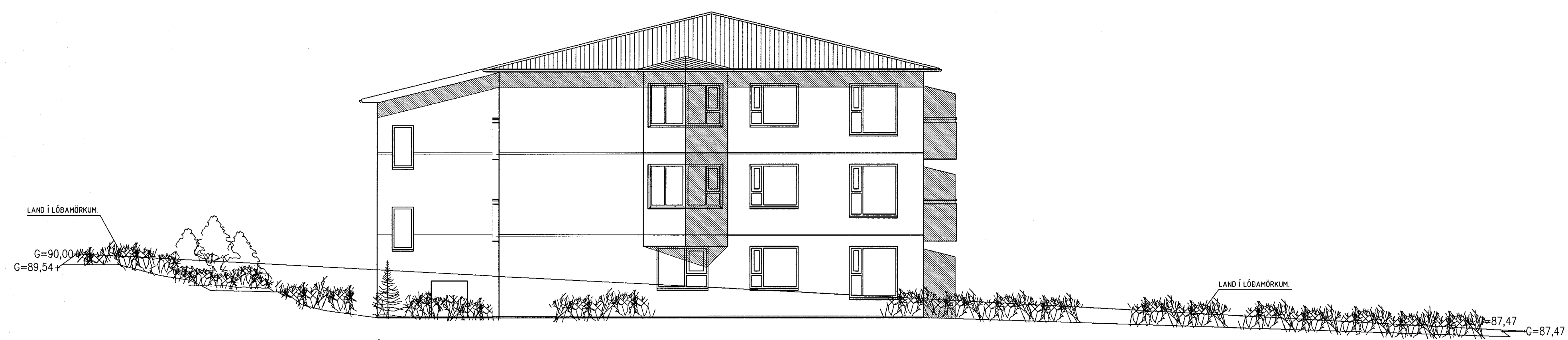
ÚTLIT NORÐAUSTUR MKV. 1:100.