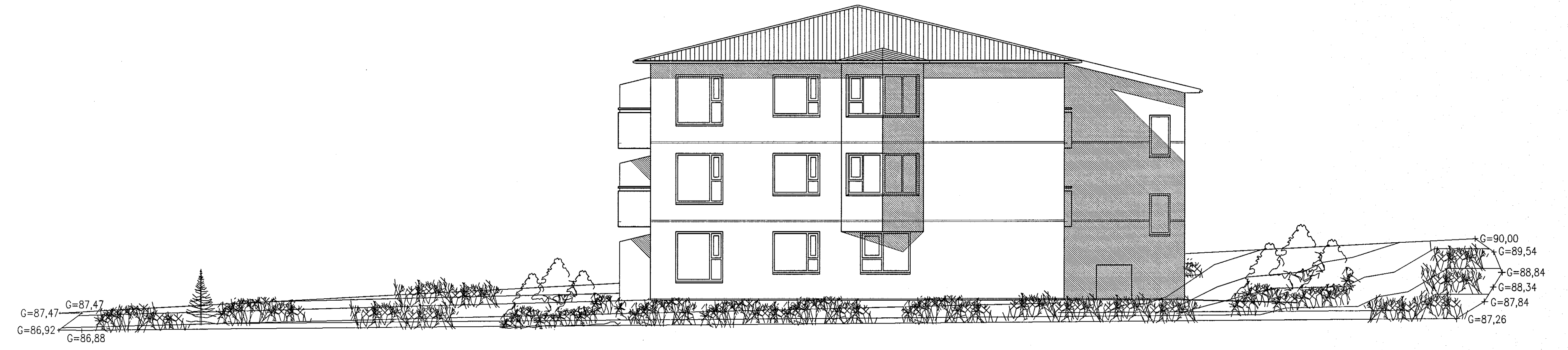
ÚTLIT SUÐVESTUR MKV. 1:100.