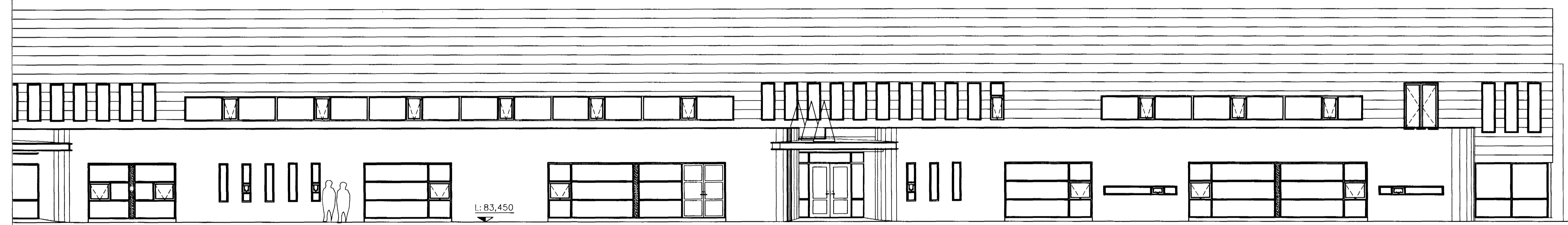
ÚTLIT VESTUR. SUÐURENDI M. 1:100