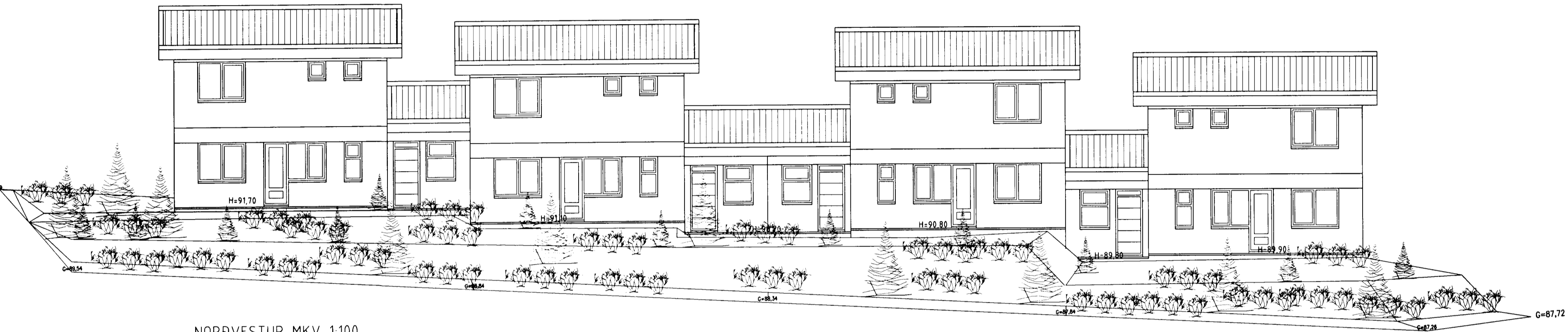
NORÐVESTUR. MKV. 1:100.

Samþykkt þannu 29 JULI 2002 Byggingafulltrúinn í Hafnarfirði F.h. Sigurbjartur Halldórsson