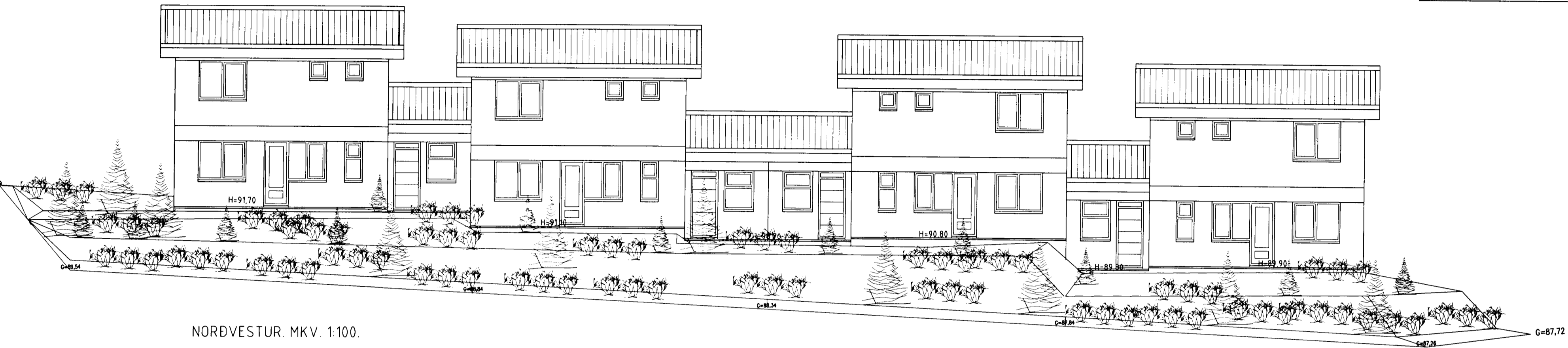
NORÐVESTUR. MKV. 1:100.

Byggingafulkrúinn í Hafnarfirði F.h. Sigurbjartur Halldórsson