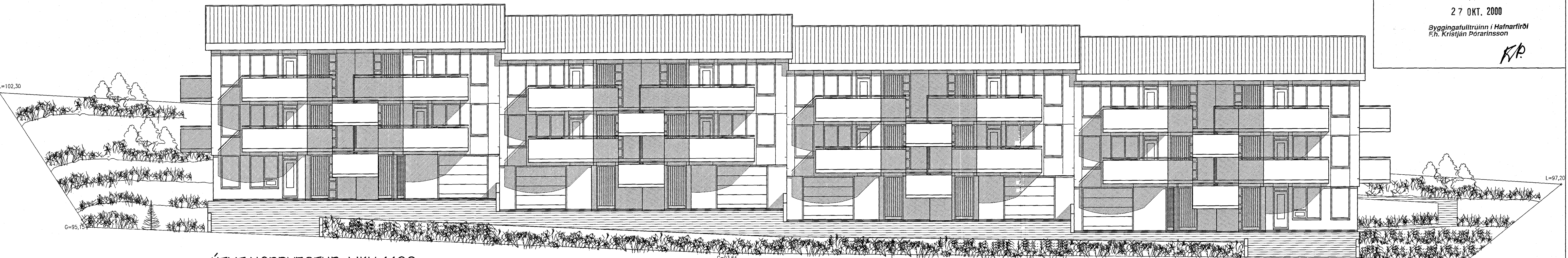
ÚTLIT NORÐVESTUR MKV. 1:100.