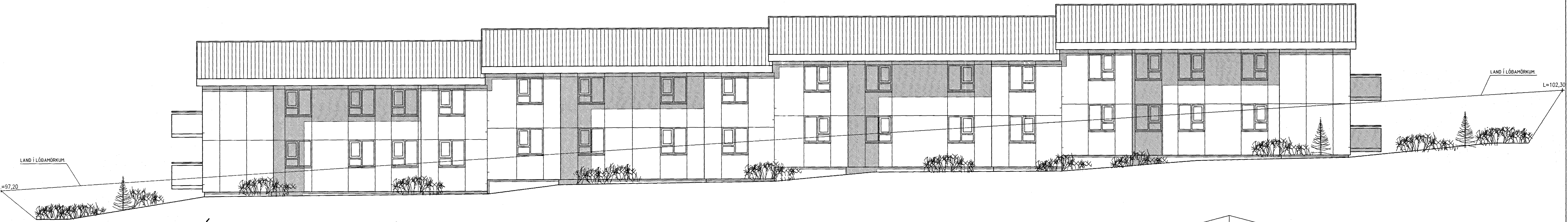
ÚTLIT SUÐAUSTUR MKV. 1:100.